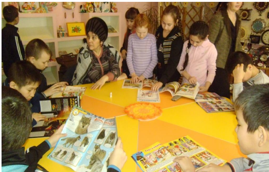
Краеведческий клуб "Бәпембә"- "Одуванчик"

В модельной центральной городской библиотеке «Информационно-библиотечный центр «Доступный город» функционирует виртуальный читальный зал; 2 рабочих места оборудованы персональными компьютерами с постоянными IP-адресами. Продолжается сотрудничество с РГБ, внедрен доступ к полнотекстовой базе «Электронная база диссертаций Российской государственной библиотеки», которая содержит 900 тысяч полных текстов диссертаций и авторефератов по всем специальностям. С 2016 года в Центральной библиотеке имеется доступ к базам данных НЭБ (Национальной электронной библиотеке), благодаря чему у горожан появилась возможность работать в электронном читальном зале с единым архивом оцифрованных изданий. В 2017 году в Центральной библиотеке подключен доступ к электронному читальному залу «Президентской библиотеки им. Б. Ельцина». С 2016 года в Центральной библиотеке открыт бесплатный доступ к электронным книгам «ЛитРес: Библиотека».