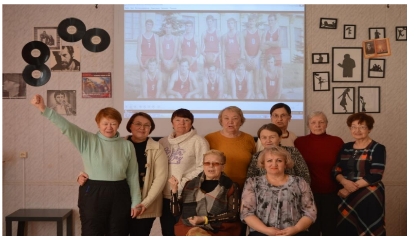
Клуб «Задумчивая беседа»

В библиотеках г.Кумертау в 2019 году активно работало 11 клубов самой различной направленности, обеспечивающих организацию досуга пользователей библиотек всех возрастов. В рамках работы клубов проведено 82 мероприятия, оформлена 31 выставка.