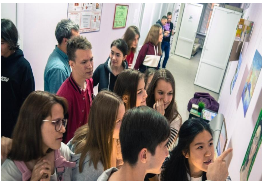
Молодежный литературный клуб «Клик»