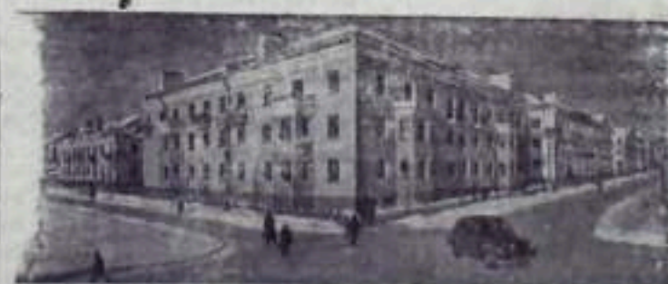
Свердловская область. Новые дома в г. Первоуральске.