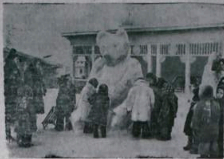
В городском детском саду № 4. НА СНИМКЕ: дети на прогулке.