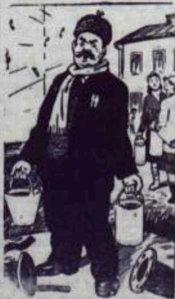
Удивительный вопрос: Отчего я водонос? Оттого, что третий год Чинят наш водопровод!

Строительные организации города не борются за качество строительства. Так, из-за недоделок в строительстве, некачественных ремонтов и неудовлетворительной эксплуатации часто выходит из строя водопровод.