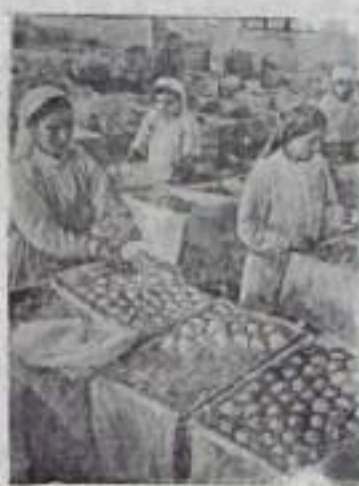
Азербайджанская ССР. Богатый урожай фруктов вырос в этом году Кубинский плодовый совхоз. На снимке: сортировка яблок в совхозе.