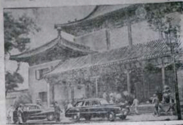
ПЕКИН. Дворец Хуайжэнтай, в котором проходили заседания Первой сессии Всекитайского собрания народных представителей и где была принята первая Конституция Китайской Народной республики.