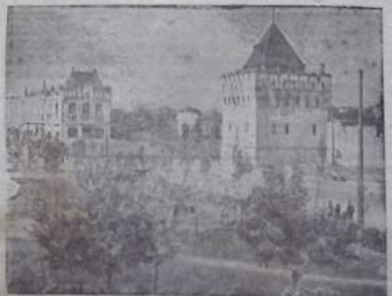
Львов. Львовский государственный театр оперы и балета.