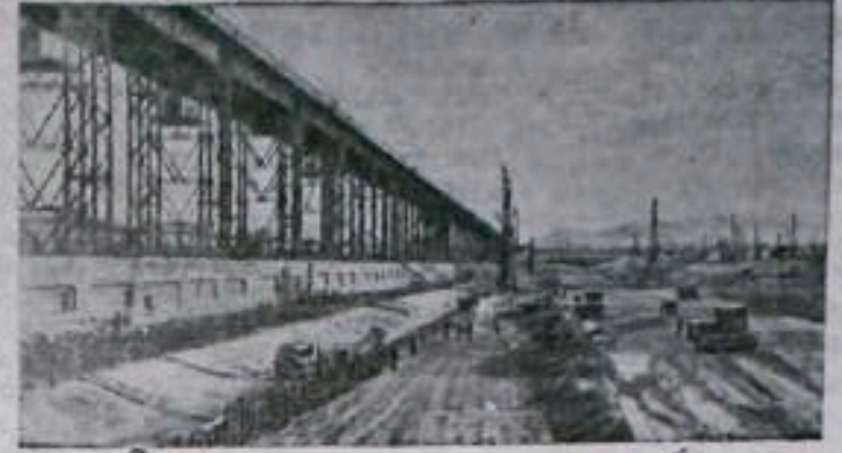
Куйбышевгидрострой. На участке строительства водосливной плотины.