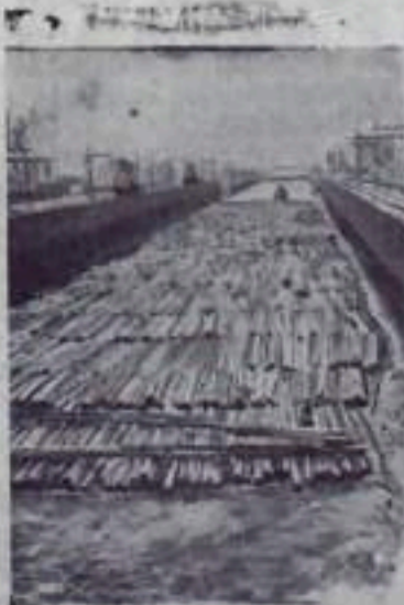
Ежедневно по Камскому мосту проходит десятки караванов судов, барж, плотов и пассажирских пароходов.