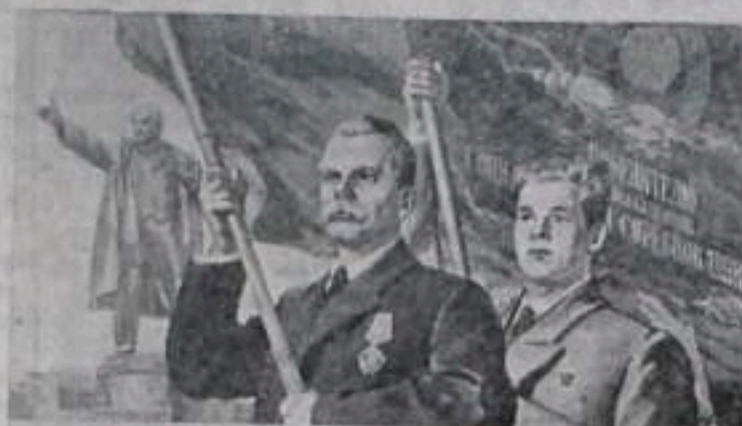
ХРАНИТЬ И РАЗВИВАТЬ РЕВОЛЮЦИОННЫЕ ТРАДИЦИИ РАБОЧЕГО КЛАССА!

Плакат художника В. Захаркина, выданный ИЗОГИЗ.