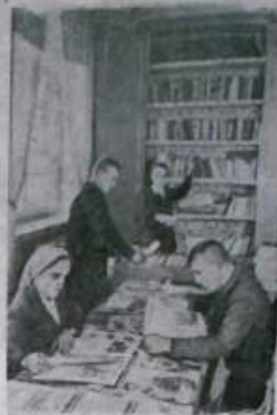
Сталинская область. Построенный в этом году клуб сельхозартели «Керновый прапор» стал культурным центром села Антоновки Марьинского района. В нем имеется артезианский зал на 280 мест, просторное фойе, комнаты для агр. библиотеки, читальни. Библиотека насчитывает около четырех тысяч книг.

М. Бариль, главный инженер Промстройуправления.