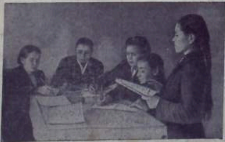
В Куюргазинском строительном управлении регулярно проходит занятия комсомольской подгруппы.