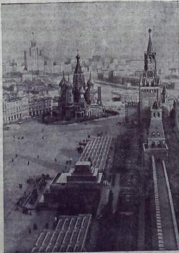
МОСКВА. Красная площадь.