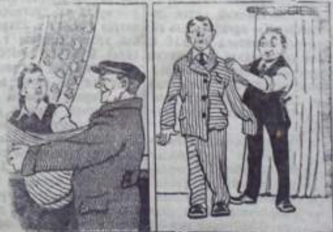
Материал сушил чудной... а костюм ошили чудной.