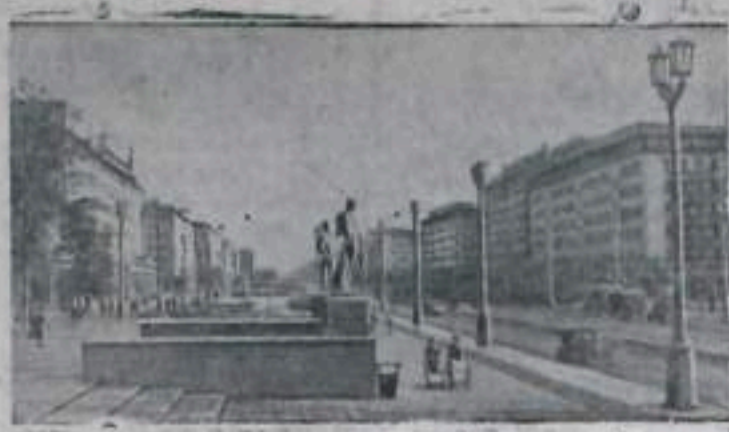
Германская Демократическая Республика. В Демократическом районе Берлина идет интенсивное жилищное строительство. На снимке: новые дома на центральной магистрали столицы — Сталли-аллее.