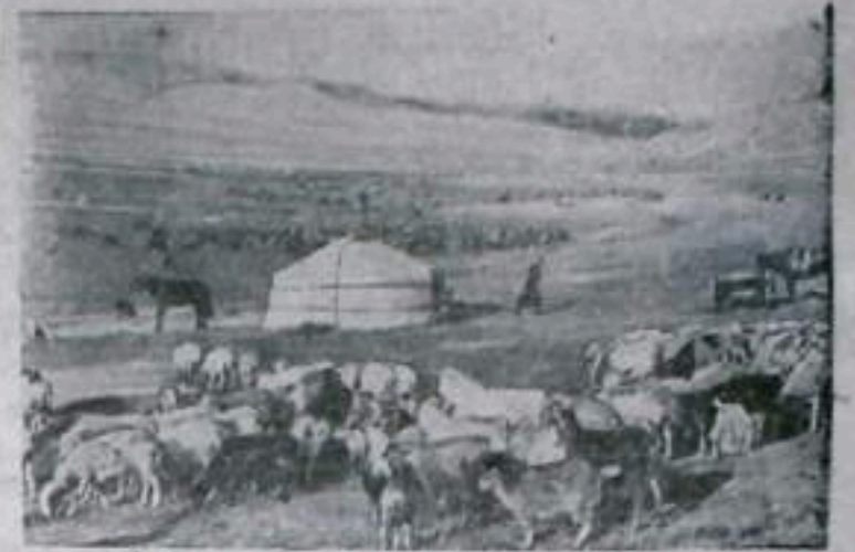
Основная отрасль хозяйства Монгольской Народной Республики — животноводство. В последние годы животноводы достигли больших успехов в увеличении поголовья скота и повышении его продуктивности. НА СНИМКЕ: на пастбищах Центрального аймала.