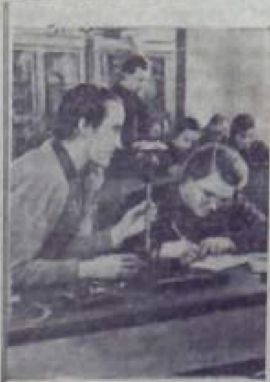
Хабаровский край. В этом году в Комсомольске на Амуре открылся педагогический институт. На двух факультетах — русского языка и литературы и физико-математическом — занимаются свыше 150 человек.