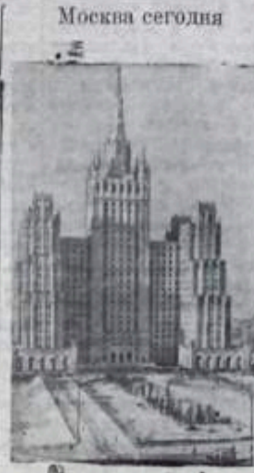
Высотное здание на площади Восстания.

Ручьевский рыбоконсервный завод треста «Ленрыба» завершил годовой план выработки консервов. Все предприятия треста за 11 месяцев и 10 дней изготовили свыше 15 миллионов банок консервов — на