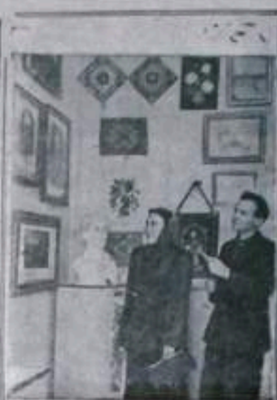
Полтава. В Полтавском художественном музее открылась областная выставка народного творчества 1954 года. На выставке представлены работы по живописи, керамике, резьбе по дереву, художественной вышивке.