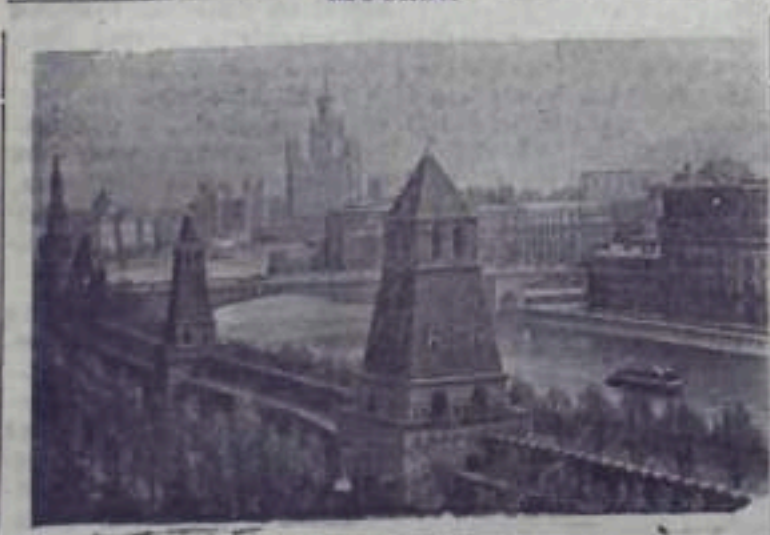
Вид из Кремля на Москву-реку.