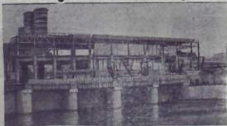
Азербайджанская ССР. Первая очередь Мингечаурской гидроэлектростанции введена в действие. Начали работать две турбины.

На окружных совещаниях представителей трудящихся Ленинградского, Молотовского и Калининского избирательных округов приняты постановления поддержать решения предвыборных собраний о выдвижении кандидатом в депутаты Совета Национальностей Верховного Совета СССР первого заместителя Председателя Совета Министров СССР, Министра Обороны СССР тов. Николая Александровича Булганина. Участники совещаний обратились с просьбой к товарищу Н. С. Булганину дать свое согласие баллотироваться в Совет Национальностей по Московскому городскому избирательному округу. Принято обращение к избирателям.