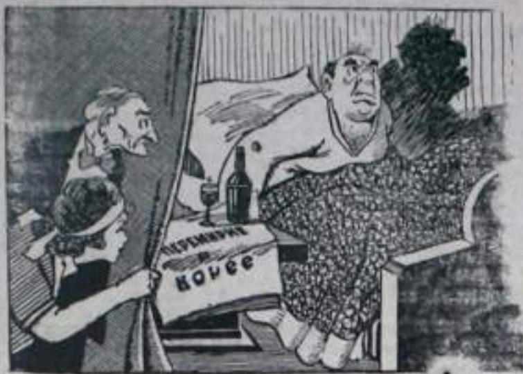
— Наш хозяин не может спокойно спать, когда не стреляют пушки.

«Главное опасение крупных бизнесменов состоит в том, что они будут лишены заказов, полученных ими в результате гонки вооружений». На статье американского экономиста В. Церао («Прайда» за 5 января 1954 года).