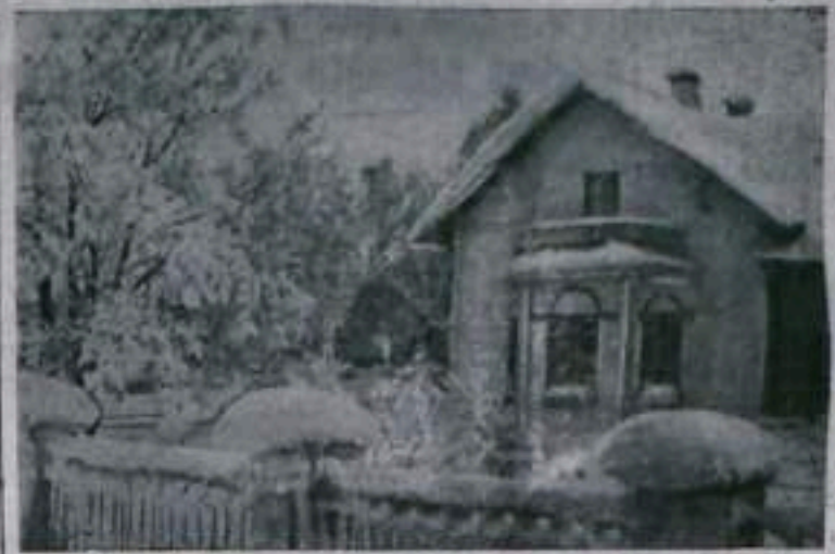
Кумертау. Жилой дом по улице Лесной.