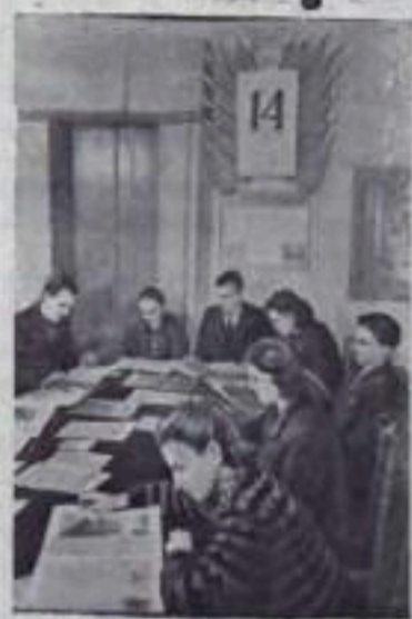
Москва. В избирательном избирательного участка № 23 Свердловского избирательного округа по выборам в Верховный Совет СССР.

На заседаниях окружных избирательных комиссий № № 367 и 432 решено включить кандидатов в депутаты Верховного Совета СССР в избирательные бюллетени для баллотировки по названным округам.