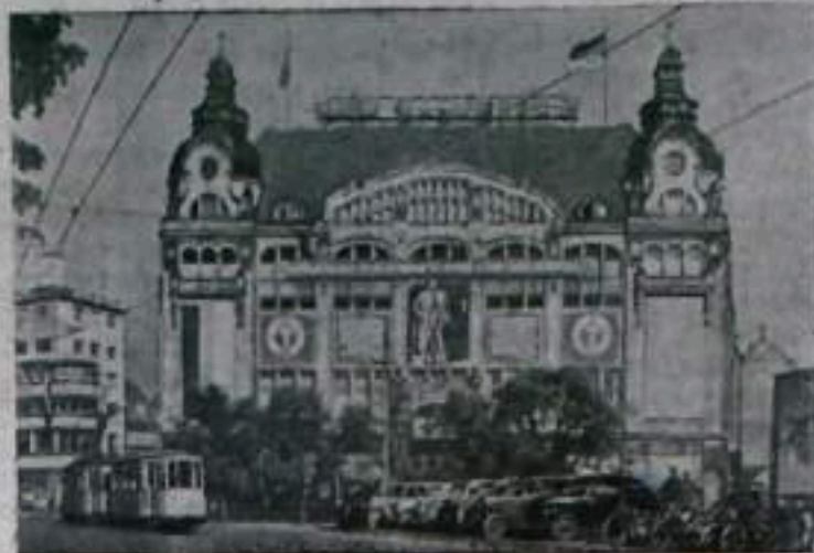
В Германской Демократической Республике непрерывно расширяется торговая сеть, расширяется ассортимент товаров массового потребления. В городах и селах открываются новые и реконструируются существующие магазины.

Касаясь политической жизни США, автор статьи пишет, что «в мире нет ни одной страны, которая столь много шумит о демократии, как США, однако то, что там существует, является жалкой пародией на демократию... США стали самыми яростными сторонниками реакции, где бы она ни проявилась. США оказывают поддержку реакционным элементам в борьбе против народных правительств в Азии, Африке, Европе и Южной Америке. Народное правительство Китая не признает-