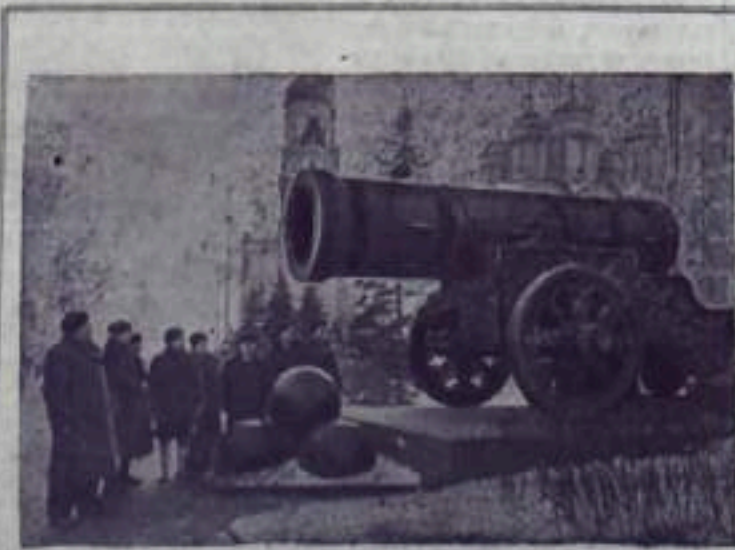
На снимке: представители Сталинградской области у «Царь-пушки».

В интересах дальнейшего увеличения выпуска продукции, ускорения темпов жилищного, культурно-бытового и промышленного строительства горком союза угольщиков и профсоюзные организации должны улучшить руководство социалистическим соревнованием, сделать его действительным.