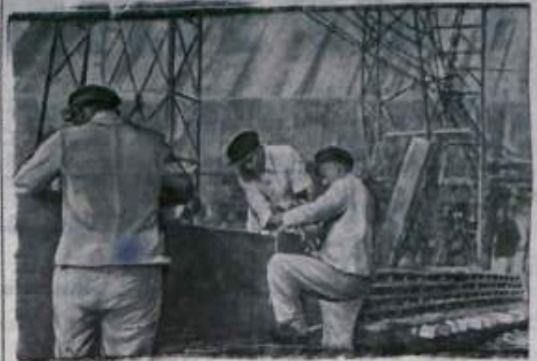
В Корейской Народно-Демократической Республике воздвигается крупнейшая Сунхунская гидроэлектростанция на реке Ялудзи (Амноккан). На снимке: изготовление железобетонных конструкций для здания Сунхунской гидроэлектростанции.