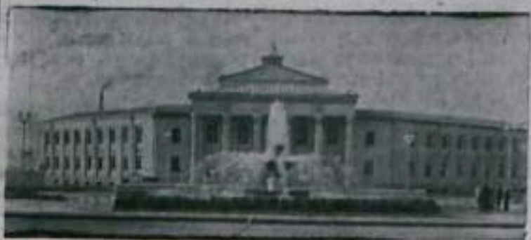
АЗЕРБАЙДЖАНСКАЯ ССР. Дворец культуры в Мингечауре для работников Мингечаурской ГЭС.