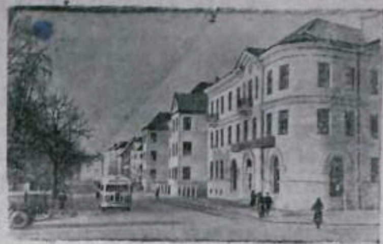
Калининград. Жители города получили в прошлом году около 40 тысяч квадратных метров новой жилой площади. В ближайшие годы будут построены еще десятки многоэтажных благоустроенных зданий. На снимке: Сталинградский проспект в Калининграде.