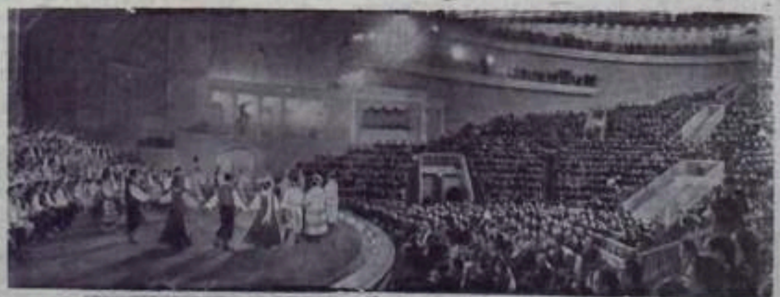
В Москве закончилась декада литовской литературы и искусства. НА СПИМКЕ: концерт государственного народного ансамбля песни и танца Литовской ССР в концертном зале имени П. И. Чайковского.

секретарь Кумертауского горкома комсомола.