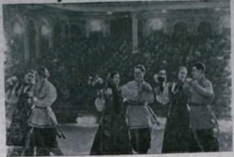
Молотов. Во Дворце культуры на областном смотре сельской художественной самодеятельности выступило более трех тысяч участников. На снимке: выступление танцевального коллектива Юльинского Дома культуры Коми-Пермяцкого национального округа.

Работает наша бригада дружно, уверенно, старается строить для народа быстро, дешево и хорошо.