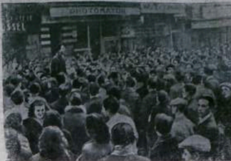
Франция. По всей стране проходят народные митинги и демонстрации протеста против парижского и боннского военных договоров. Французы высказываются против создания «европейской армии», они не желают быть пушечным мясом в войне, подготавливаемой американскими империалистами. На снимке: митинг французских трудящихся в городе Марселе.