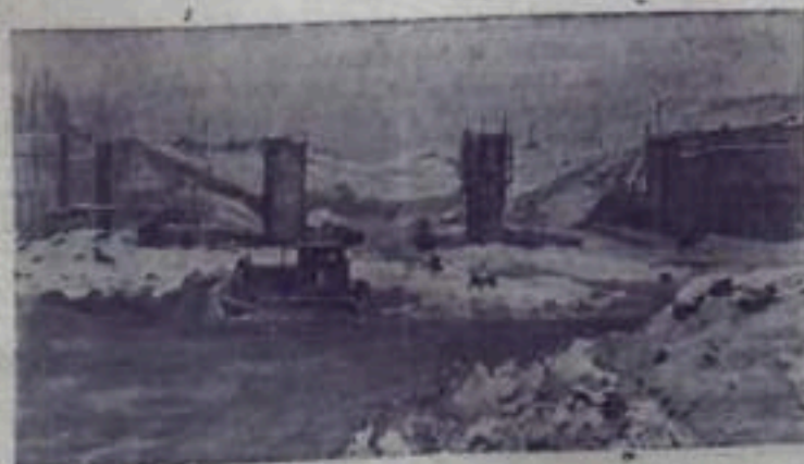
Эстонская ССР. На правом берегу реки Нарвы развернулось строительство мощной Нарвской гидроэлектростанции, предусмотренное директивками XIX съезда КПСС.