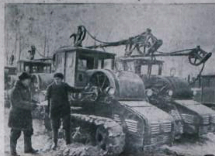
Украинская ССР. Работники Харьковского тракторного завода имени Орджоникидзе, расширяя социалистическое соревнование в честь 300-летия воссоединения Украины с Россией, обильно подготовили опытную партию электротракторов «ХТЗ-12». На снимке: партия электротракторов «ХТЗ-12», подготовленная к отгрузке в Корею—Шенгенскую МТС.

Освоение 13 миллионов гектаров целинных и залежных земель является началом больших общегосударственных работ по вовлечению обширных массивов не используемых земель для увеличения производства зерна и других сельскохозяйственных продуктов. На решение важной общенародной задачи широко поднялись трудящиеся, и в первую очередь молодежь, всех областей и республик Советского Союза. Все это убедительно свидетельствует о том, что советские люди горячо поддерживают мероприятия партии и правительства по дальнейшему подъему сельского хозяйства.