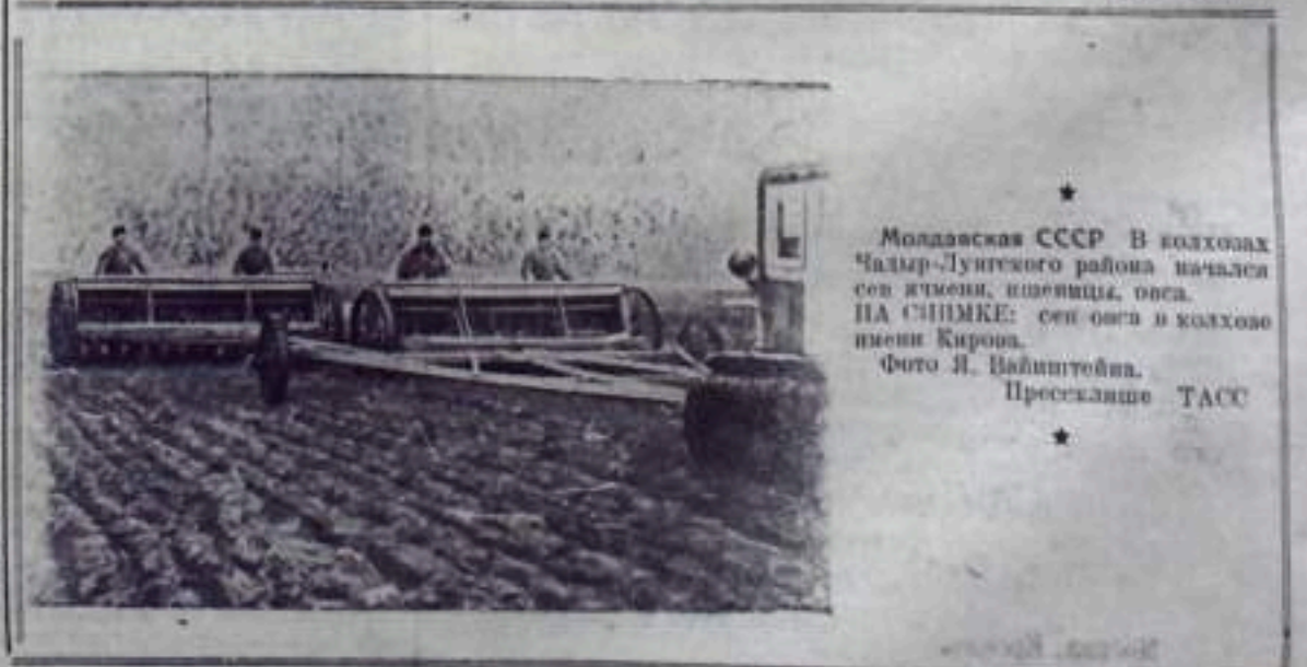
Молдавская ССР. В колхозах Чалыр-Лунтского района намалел сев ячменя, шперици, овса. НА СПИМКЕ: сев овса в колхозе имени Кирова.