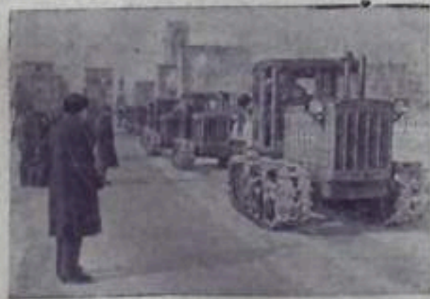
Ежедневно с отгрузочной площадки Алтайского тракторного завода имени М. И. Калинина отправляются в МТС для подъема плугов и вспашки земель тракторы «ДТ-54».