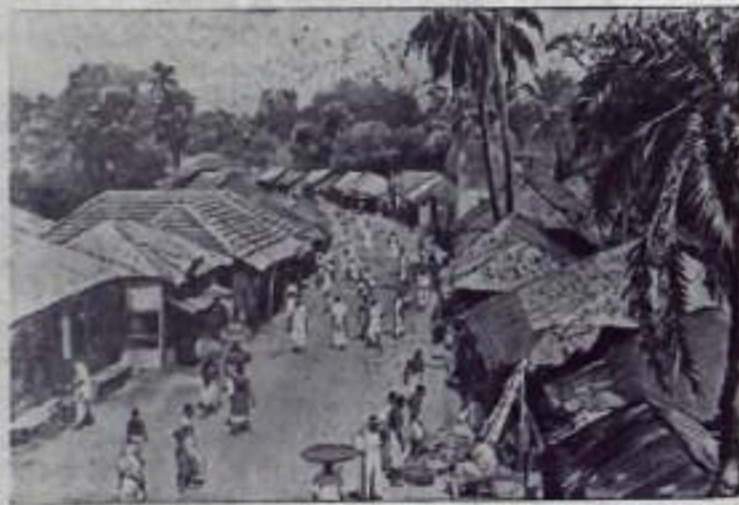
Индия. Торговая улица большой деревни в Западной Бенгалии. Деревня расположена на шоссе, ведущем из Калькутты в штат Бихар.

иностранных дел СССР В. М. Молотова на Берлинском совещании о создании системы коллективной безопасности в Европе с участием всех государств Европы. Митинги и демонстрации протеста состоялись также в различных районах Западной Германии и в различных секторах Западного Берлина. (ТАСС).