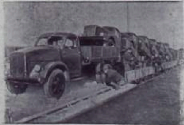
Горьковский автозавод имени В. М. Молотова отгружает автомашины в МТС, осваивающие целинные и залежные земли.