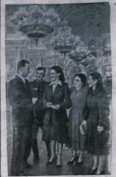
В Большом Кремлевском дворце в дни работы XII съезда Всесоюзного Ленинского Коммунистического Союза Молодежи.

НА СНИМКЕ: делегаты XII съезда ВЛКСМ в Георгиевском зале.