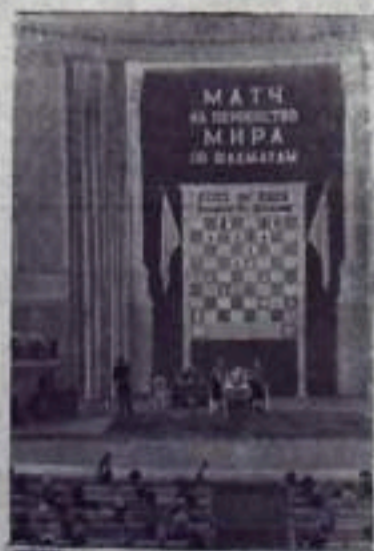
27 марта в концертном зале Центрального Дома Советской Армии состоялась шестая партия шахматного матча на первенство мира. На 34-м ходу гроссмейстеры отыгрались на ничью. Таким образом, после шести партий шахматного матча на первенство мира счет стал 4,5:3,5 в пользу Ботвинника. НА СНИМКЕ: в зале во время игры