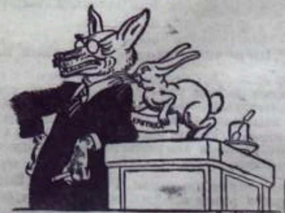
Приятна критика для слуха. Та, что щечечет только ухо.

Критика — как ее понимают отдельные работники треста «Башуглеразрезстрой»