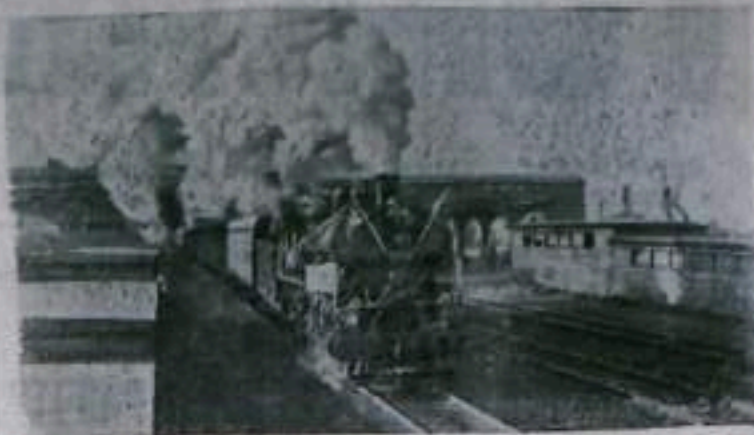
Между столицами Китайской Народной Республики и Советского Союза установлено регулярное пассажирское беспересадочное сообщение.

НА СНИМКЕ: поезд Пекин—Москва отходит от станции Филин (Мурман).