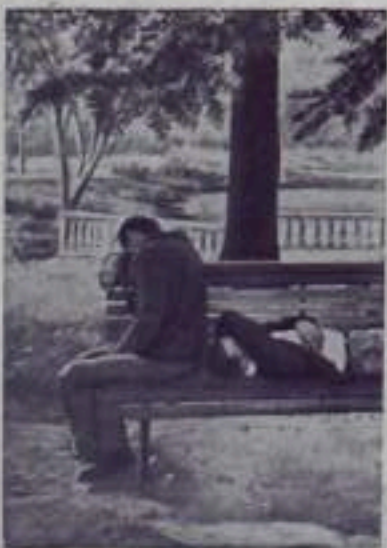
Смертывание производства в Италии приводит к массовой безработице. Миллионы трудящихся не могут найти применения своим силам. Не имея возможности платить за жилье, безработные ищутся в пещерах, заброшенных помещениях и в самодельных хижинах. Некоторые лишены всякого крова. Их домом является улица, выстелая — жесткая земля и парки.