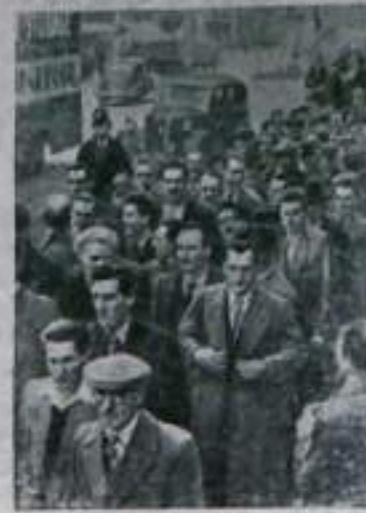
Надземные предприятия Англии продолжают ухудшать условия труда. Это вызывает протесты рабочих. Недавно в Лондоне состоялся демонстрационный забастовочный митинг, затеявший перенос нефтепродуктов. Они представляли нефтяным компаниям ряд условий митинговых требований. НА СНИМКЕ: демонстрация рабочих.