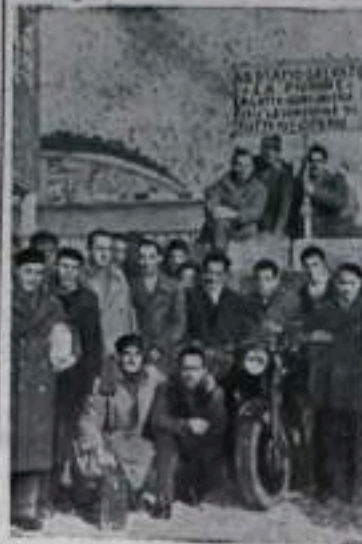
В Италии не прекращается забастовочное движение. Более двух месяцев не покидали забастовавшие рабочие здание завода «Пильоне» в г. Массе.

В капиталистических странах не существует свободы слова для трудящихся. Этим правом широко и беспрепятственно пользуются поджигатели войны и вракобесы, открыто призывающие к новой мировой войне. Им ничего боится преследований: они вымывают волю своих хозяев.