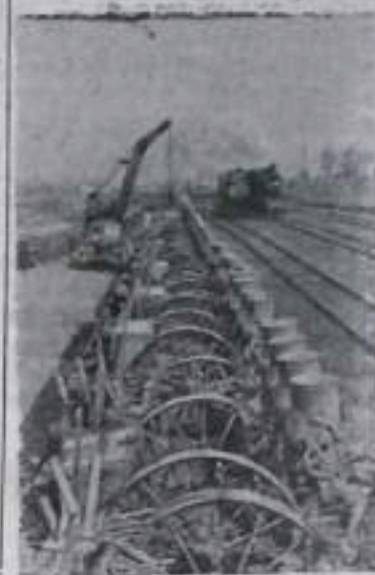
На Минскую базу Сельхозмаша для машинно-тракторных станций и совхозов Минской области прибывает различная сельскохозяйственная техника.