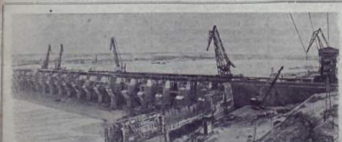
На строительстве Камской гидроэлектростанции заканчивается сооружение мощной железобетонной водосливной плотины и готовится к пуску первый плыв, по которому уже в этом году будет пропущена сызлавская водосливная плотина.

НА СНИМКЕ: общий вид верхнего бьефа водосливной плотины.