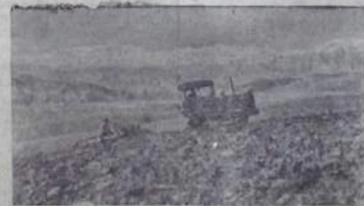
Таджикская ССР. В колхозах республики проводят распахивание земель под будущие посевы зерновых и мясных культур. НА СПИМКЕ: возделана целина на косогорах в колхозе имени Сталина Сталинобадского района.

2. Поручить Совету Министров СССР продолжать выполнение своих обязанностей впредь до утверждения настоящей сессией Верховного Совета СССР нового состава Правительства СССР.