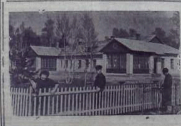
Литовская ССР. В работе поселка торфоразработки «Энергия» Павловопольского района за последние два года построено много жилых домов, бани, детские ясли. НА СНИМКЕ: детские ясли в рабочем поселке.