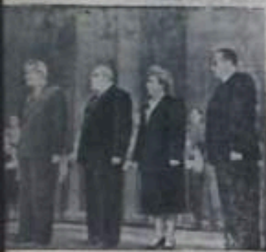
В русском драматическом театре состоялось выступление Государственного театра имени Пятницкого. Украинского искусства приветствуют.