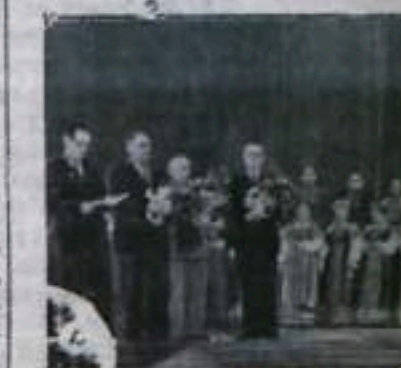
В Киевском государственном театре имени Леси Украинки состоялось представление украинского народного хора НА СНИМКЕ: деятели украинского народного хора встречают русских гостей.

Наши колхозы, совхозы, фабрики и заводы, города и села были опустошены. А теперь они не только восстановлены,