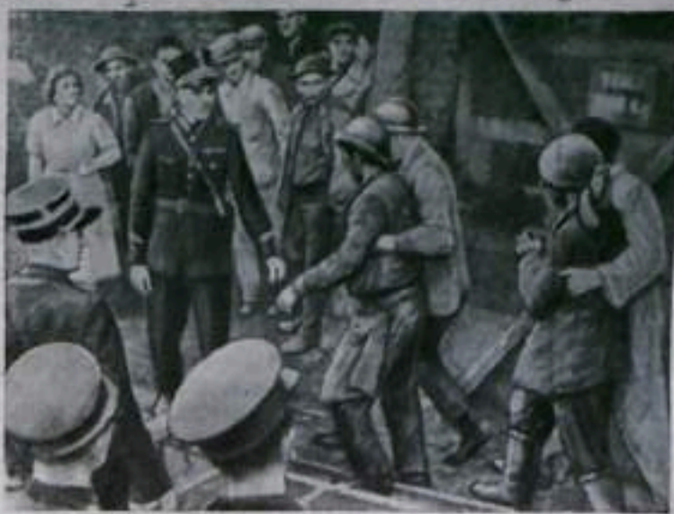
Владельцы бельгийских шахт не заботятся об охране труда. В результате плохой постановки техники безопасности нередко происходят катастрофы с человеческими жертвами. Недавно на одной из шахт района Серен произошел взрыв. Было убито и ранено много шахтеров.

НА СНИМКЕ: отправка в больницу шахтеров, пострадавших при взрыве.