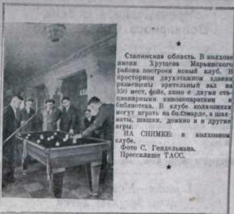
Сталинская область. В колхозе имени Хрущева Марьинского района построен новый клуб. В просторном двухэтажном здании размещены зрительный зал на 350 мест, фойе, кино с двумя стационарными киноаппаратами и библиотека. В клубе колхозники могут играть на бильярде, в шашки, шахматы, домино и в другие игры. На снимке: в колхозном клубе.

Быстрейшее внедрение и жизнь мероприятий, направленных на повышение производительности труда, широкое распространение почин передовых бригад экскаваторщиков, принявших на себя обязательство довести годовую выработку на каждый экскаватор до миллиона кубометров, будут способствовать успешному решению задачи по производству вскрыши на пусковых объектах.