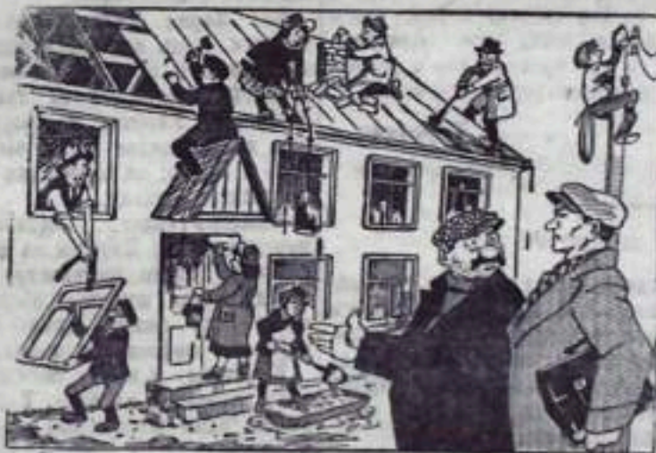
— Вы говорите, что этот дом уже заселен? А я вижу, там еще идет работа. — Так это жильцы кое-какие недоделки заканчивают.

В Кумертауском строительном управлении, Малчиного шахтостроительного управления и Промстройуправления внедряется хорошая практика сдавать в эксплуатацию новые дома с множеством недоделок, с небрежно выполненными работами. Балконы недоделываются. Отсутствует внешняя штукатурка и побелка. Площадь вокруг домов не благоустраивается. Это обещивает качество жилья и вызывает справедливые претензии трудящихся. (Из писем в редакцию).