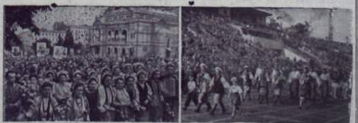
Все народы нашей страны отметили знаменательную дату 300-летия воссоединения украинского и русского народов. 23 мая в честь праздника в столице Советской Украины — орденноносном Киеве состоялся военный парад и демонстрация представителей трудящихся. В Москве состоялись народные гуляния и спортивные выступления.