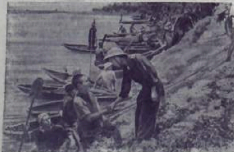
Демократическая Республика Вьетнам. Весь вьетнамский народ помогает своей армии бороться против французских захватчиков. Патриоты оказывают помощь фронту продовольствием, помогают военным подразделениям продвигаться в джунглях, форсировать реки. НА СНИМКЕ: командир отряда вьетнамской Народной армии благодарит рыбаков за помощь при форсировании реки.