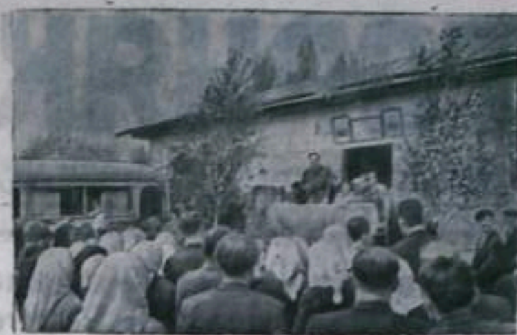
Киевская область. В сельхозартеле имени Т. Г. Шевченко Киевско-Светловодского района состоялась встреча колхозников с писателями и артистами — участниками декады русской литературы и искусства в Киеве, показавшей 300-летие воссоединения Украины с Россией.