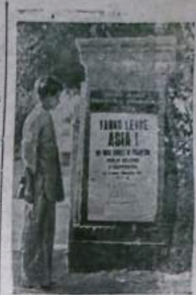
В Индии растет волна протестов против заключения военного соглашения между США и Пакистаном.