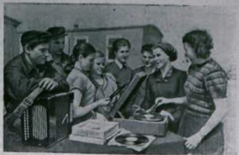
Омская область. На юге области, на целинных землях создается новый совхоз «Сибиряк». Ему в нынешнем году предстоит освоить шесть тысяч гектаров целинных и залежных земель и вспахать под пар пятнадцать тысяч гектаров. Работники совхоза трудятся с большим подъемом. Многие из них вдвое перевыполняют сменные нормы.

НА СНИМКЕ: на поленом стане. В свободное от работы время молодые рабочие совхоза слушают патефон.