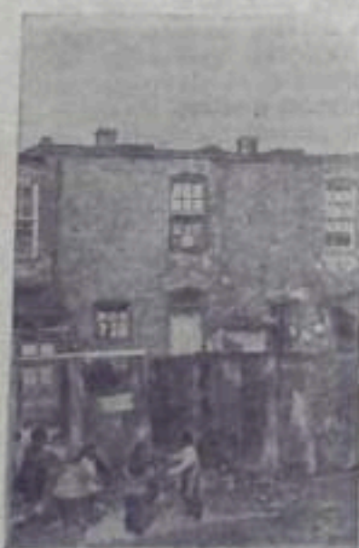
Этот снимок, изображающий британских детей у жалких лачуг в пригородной части города Вашингтона, был опубликован в американском журнале «Сатердей evening пост».

Продолжает ухудшаться положение трудящихся Уругвая. В стране растут цены на продукты питания и предметы народного потребления, сокращается реальная заработная плата. (ТАСС).