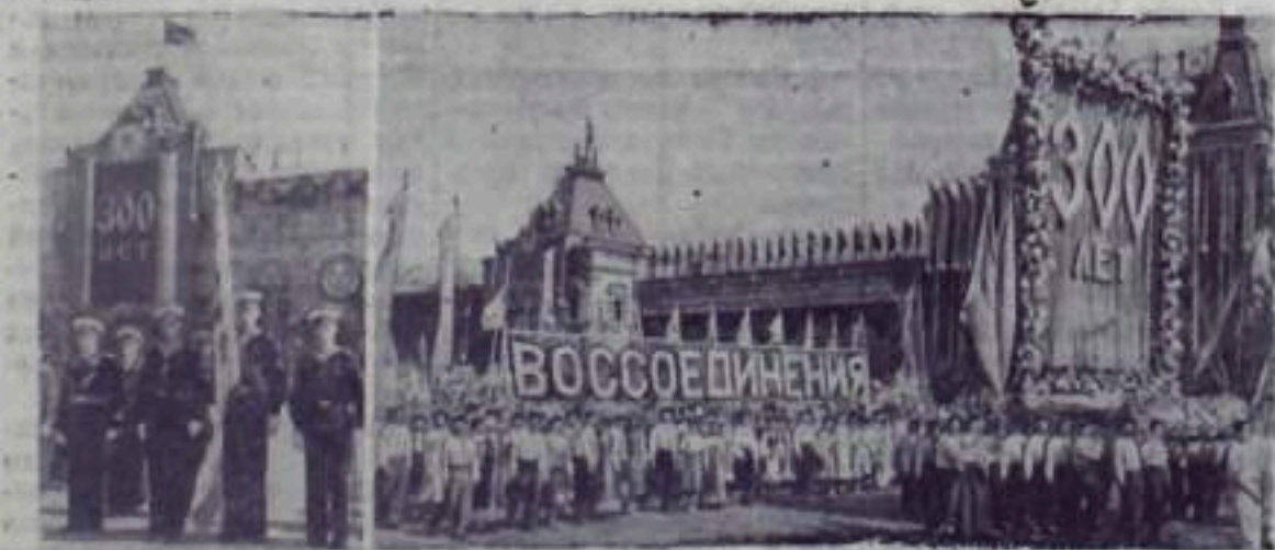
Москва, 30 мая 1954 года.