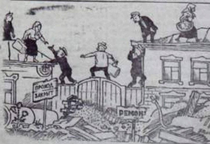
Вдоль, да по улице!

Строители не всегда планомерно ведут благоустройство города. Нередко начатые работы подолгу не заканчиваются. Так, по Пионерскому переулку прорыты траншеи для прокладки парового отопления. Укладка же труб и засыпка траншей задерживается и, видимо, не скоро будет сделана. Это затрудняет движение и приносит жителям большие неудобства.