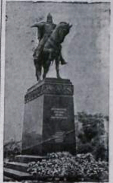
В Москве на Советской площади для установления памятника Юрию Долгорукому. На постаменте из темного полноразмерного гранита высечены надписи: