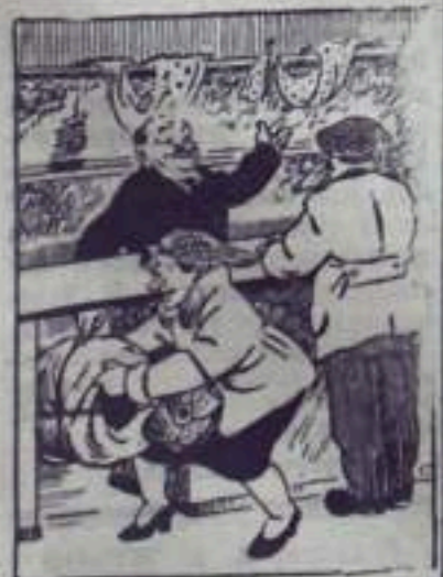
Лавочка из-под прилавочника.

В ряде магазинов города попрежнему наиболее нужные товары продаются из-под прилавка родственникам и знакомым.