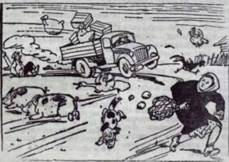
Как злойный ураган горюч Несется вскачь автолихач.

хорошо знает состояние дороги, по которой проходит маршрут, внимательно наблюдает за ней во время движения. Это уменьшает количество резких поворотов руля, резких торможений и предохраняет механизмы и агрегаты автобуса от динамических нагрузок.