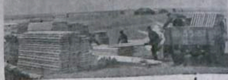
Казахская ССР. Осенью нынешнего года на просторах степей Алмаатинской области вырастет 17 поселков. Это будут центральные усадьбы новых агропоселков, осваивающих целинные земли. На месте строительства поселков уже возводятся детали оборных домов.