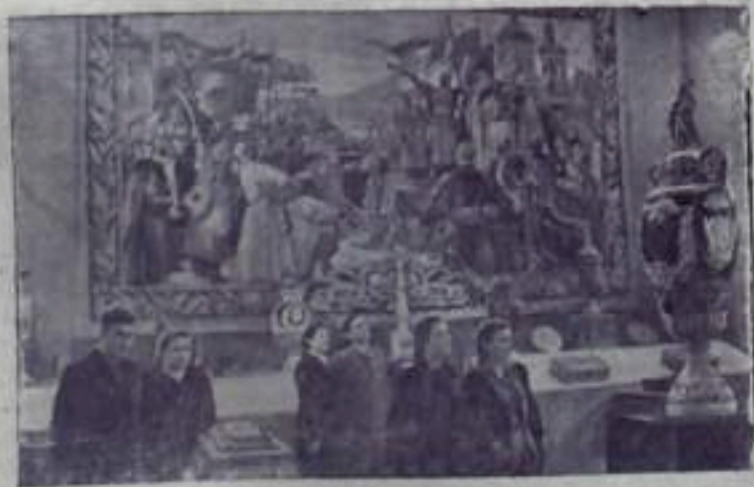
Москва. В залах Исторического музея организована выставка подарков РСФСР от братских народов страны. Эти подарки прислали в ознаменование 30-летия воссоединения Украины с Россией. НА СНИМКЕ: в зале выставки подарков от украинского народа.

секретарь парторганизации Ермолаевского управления треста «Проектмонтаж».