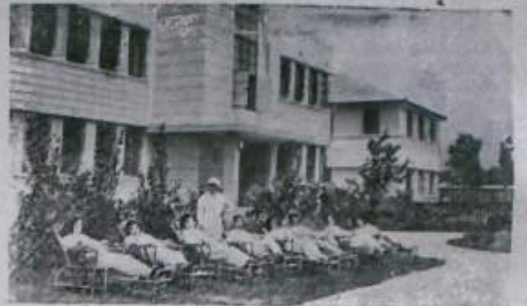
Профсоюз Китайской Народной Республики проявляет большую заботу о здоровье и отдыхе трудящихся. НА СНИМКЕ: в санатории профсоюз почтово-телеграфных работников.