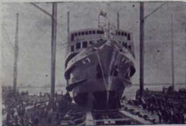
Китайская Народная Республика. Недавно на Цаньских верфях в Шанхае спущено на воду первое пассажирское судно «Минчжу» («Мечта»), водоизмещением в 1.500 тонн. Судно предназначено для плавания по внутренним речным магистралям страны. В его каютах могут разместиться 974 пассажира, в трюме — 350 тонн груза. «Минчжу» будет совершать рейсы по реке Янцзы между Шанхаем и Чунцином. НА СНИМКЕ: спуск на воду пассажирского судна «Минчжу»