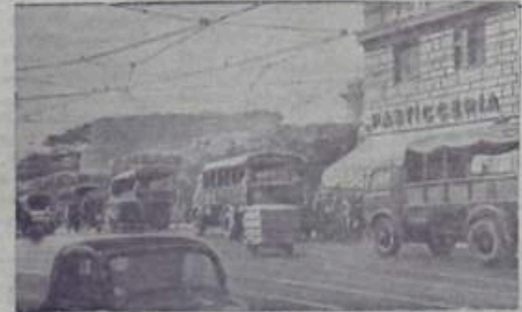
Италия. Педажи в Риме. Быстро движутся работники грижано, троллейбусов и автобусов, трюбу монументальной архитектуры. Вокруг пылаются сорвать забастовку, озарена ослепительными лучами марш рутам городского транспорта. Однако, инспекторы предотвратили же пользоваться услугами знаменитого редовитца. Забастовка закончилась победой трудящихся.

НА СНИМКЕ: воины в трудной обстановке редеют на улицах Рима.