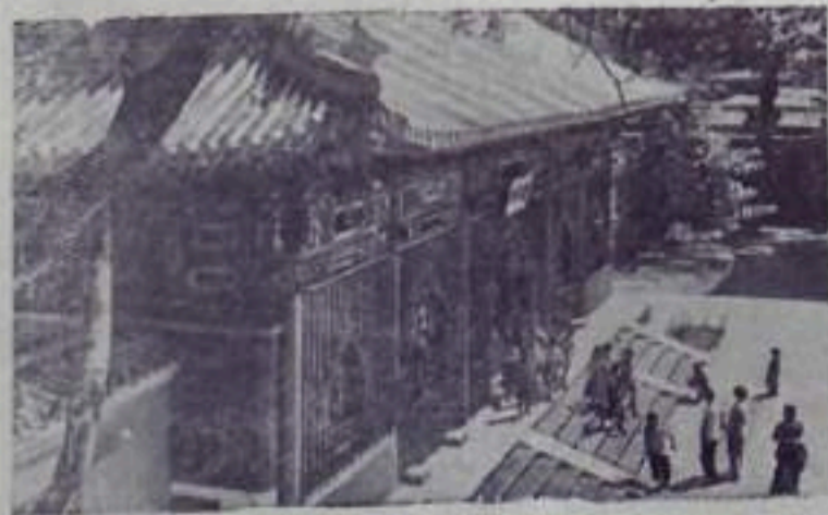
Китайская Народная Республика. В песчаном паре Байхай открыт дом китайских пионеров. Он пользуется огромной популярностью среди мальчишек и девочек китайской столицы. В работе кружка принимают участие около полутора тысяч пионеров.

НА СНИМКЕ: Дом китайских пионеров в паре Байхай.