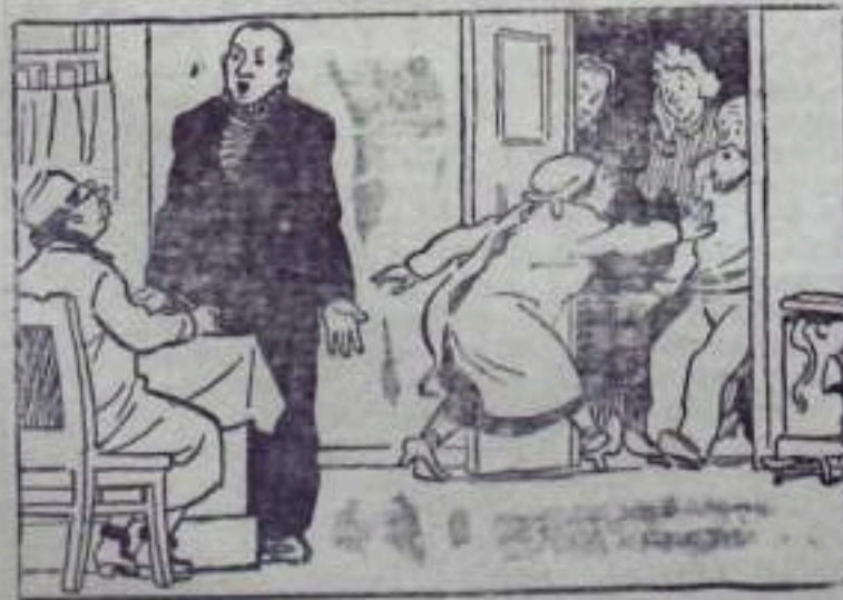
— На что жалуетесь? — На грубость...

Со стороны городского отдела милиции принимаются меры к устранению указанных недостатков.