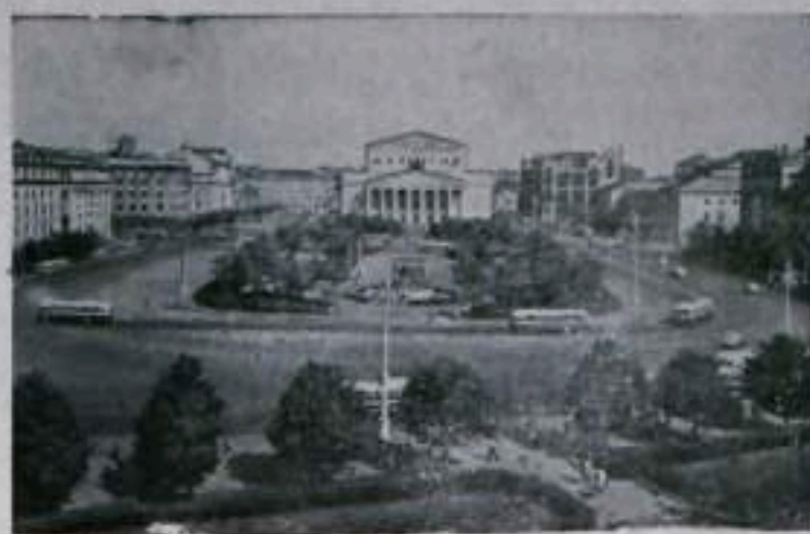
Москва, Площадь Свердлова.