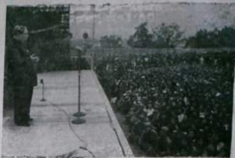
Недавно делегация мастеров советского искусства посетила Корею. Народная Демократическая Республика. Артисты выступили с концертами, на которых присутствовало свыше 750 тысяч человек.

НА СНИМКЕ на концерте в Пхеньяне. Выступает народный артист СССР М. Д. Михайлов.