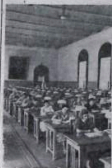
Тамбов. Книжный фонд областной библиотеки имени А. С. Пушкина насчитывает 200 тысяч томов. НА СНИМКЕ: в большом читальном зале.

8 сентября исполнилось 40 лет со дня героического подвига и гибели славного русского летчика П. Н. Нестерова. Трудящиеся страны свято чтут память П. Н. Нестерова. В городах и селах, на предприятиях и в учреждениях проводятся доклады и беседы, организуются выставки, посвященные русскому авиатору.