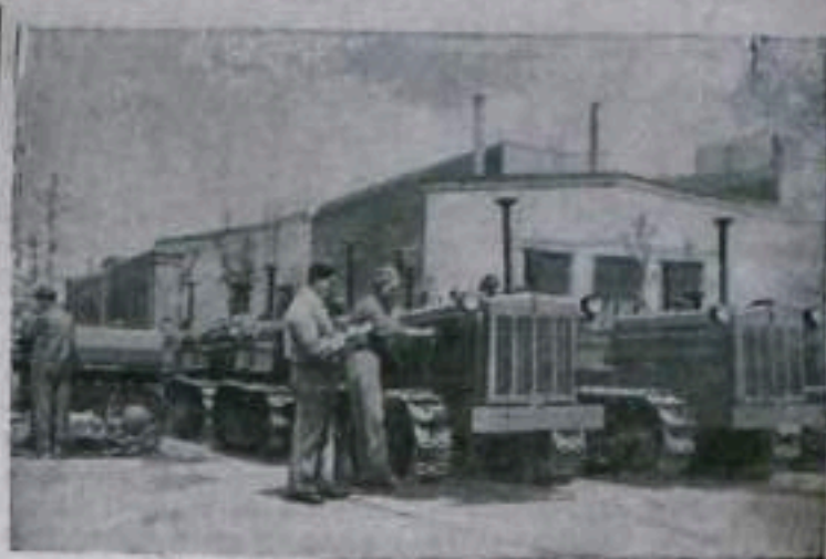
За годы народной власти промышленность Румынской Народной Республики добилась огромных успехов. Расширены старые предприятия, создан ряд новых отраслей промышленности. С помощью Советского Союза в городе Сталия построены первый в стране тракторный завод. С конвейера завода сходят тысячи мощных машин.

НА СНИМКЕ: проверка тракторов перед отправкой на сезон.