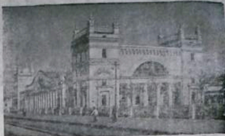
СМОЛЕНСК. Железнодорожный вокзал.

Долг всех хозяйственных руководителей, партийных, комсомольских и профсоюзных организаций, долг всего населения — выполнять это решение, организованно провести месячник по благоустройству и озеленению города.