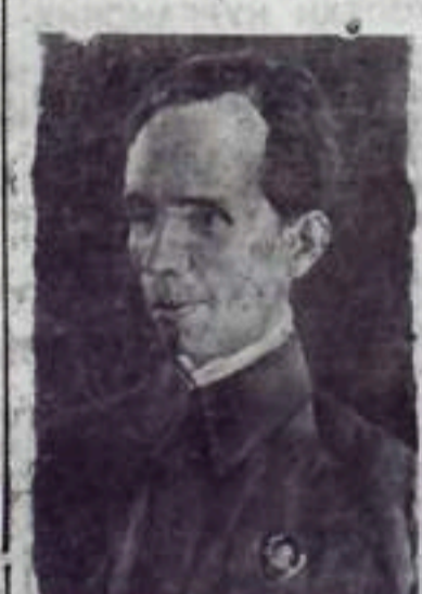
Николай Алексеевич Островский (1904—1936 гг.)

Собрания проходят под знаком острой критики недостатков. Комсомольцы выносят решения, направленные на улучшение всей дальнейшей работы организаций.