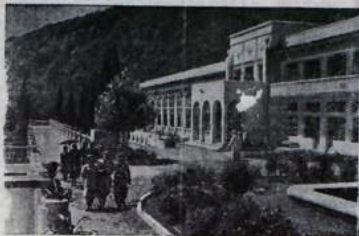
Южный берег Крыма. Санаторий „Куршаты“.