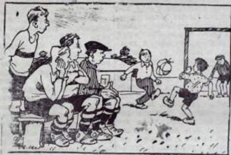
«Болельщики» по неволе