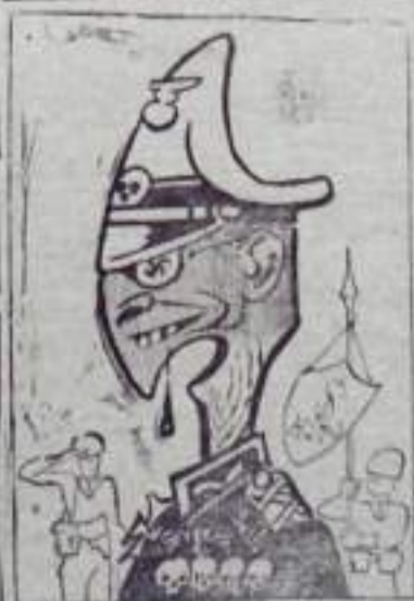
Лицо генерала Швейделя. Рис. В. Вальба (г. Ленинград).