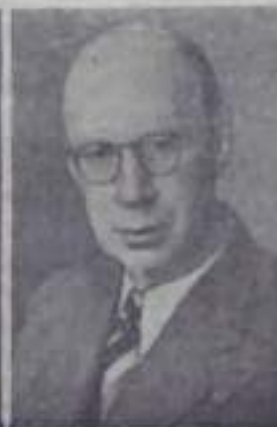
С. С. ПРОКОФЬЕВ, композитор, народный артист РСФСР.