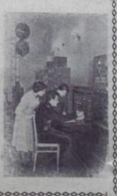
7 ЛЕНИНГРАД. На шести факультетах одного из старейших вузов страны — Института инженеров железнодорожного транспорта имени академика В. И. Образова обучаются более шести тысяч студентов. Лаборатории института оснащены новейшим оборудованием. Так, на электротехническом факультете в лаборатории автоматизации и телемеханики установлена аппаратура автоблокировки, автопостов, диспетчерской и маршрутной централизации, применяемых на железнодорожном транспорте для увеличения пропускной способности и безопасности движения поездов.