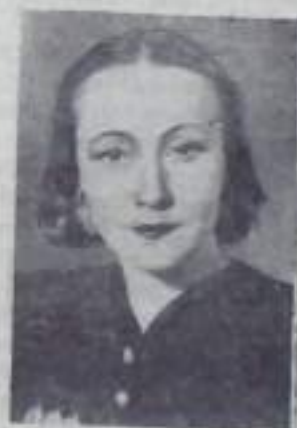
Г. С. УЛАНОВА народная артистка СССР