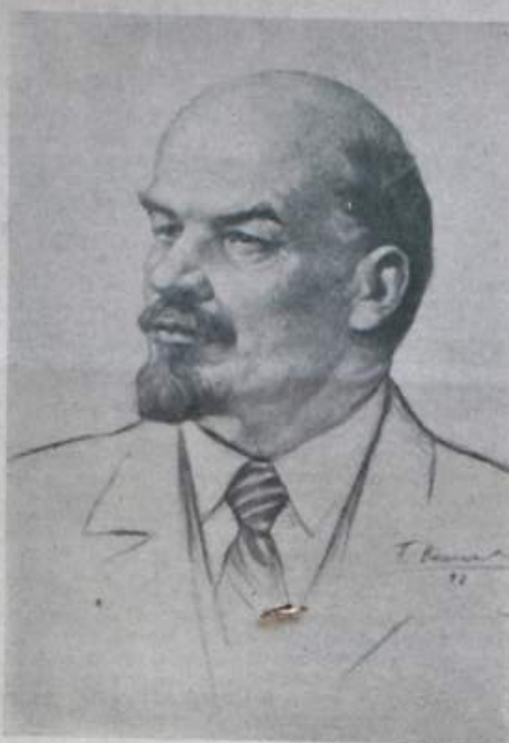
В. И. ЛЕНИН.

В голодные годы рабочие и крестьяне заботились о Ленине, занятом гигантской работой, присылали ему гос-