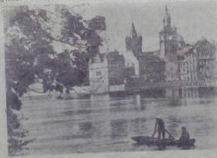
Прага. Вид на реку Влтаву и музей Б. Сметаны.

Шире развернуть подготовку к празднованию 40-й годовщины Великого Октября.