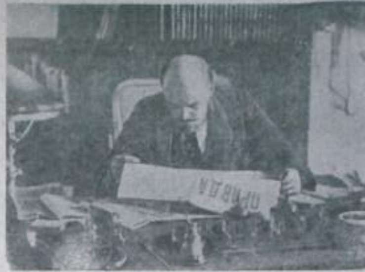
В. И. Ленин в рабочем кабинете в Кремле (1918 г.).