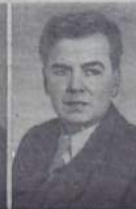
Л. М. ЛЕОНОВ, писатель.