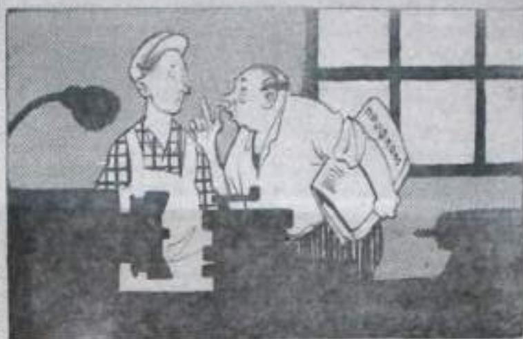
ПРЕДСЕДАТЕЛЬ МЕСТКОМА г. БЕРДИКОВ: — Вы, молодой человек, заняли первенство в соревновании. Тсс... Между нами...

Вгородской автотранспортной конторе результаты соревнования водителей автомашин и ремонтных рабочих не предают гласности. Обмен передовым опытом не организован.