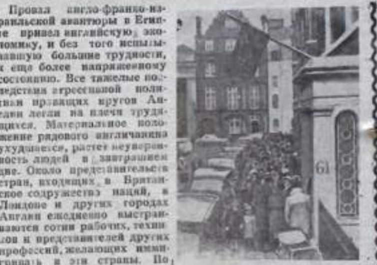
Провал англо-франко-италийской авантюры в Египте привел английскую экономику, и без того испытывавшую большие трудности, к еще более напряженному состоянию. Все тяжелые последствия агрессивной политики правящих кругов Англии легли на плечи трудящихся. Материальное положение рядового англичанина ухудшилось, растет неуверенность людей в завтрашнем дне. Около представителей стран, входящих в Британское содружество наций, в Лондоне и других городах Англии ежедневно выстраиваются сотни рабочих, технологов и представителей других профессий, желающих иммигрировать в эти страны. По сообщениям иностранной печати, в течение 1956 года надежные иммиграционные власти зарегистрировали 45 тысяч беженцев на Англию, 60 тысяч англичан выехало в этом же году в Австралию. Значительное количество заявок на въезд получено Новой Зеландией и другими странами. По оценкам зарубежной печати, если в