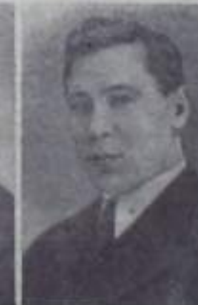
МУСА ДЖАЛИЛЬ, поэт, Герой Советского Союза.