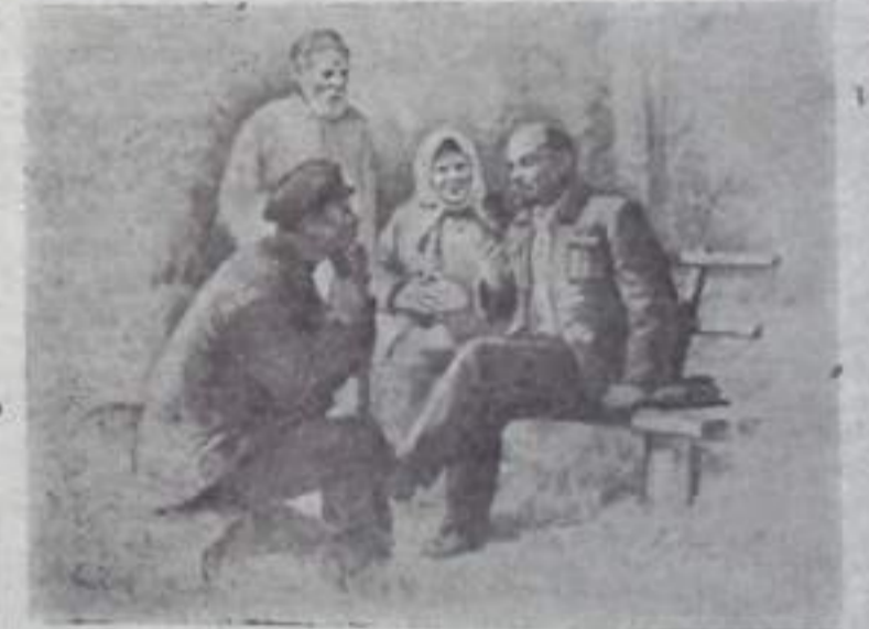
В. И. Ленин беседует с крестьянами в Горках.

щадь, поднимается на броневик. Никогда в жизни не переживал я таких радостных минут. И тысячи людей вокруг меня так же радовались, приветствовали Ильича. А когда Ленин закончил свою речь и произнес свой исторический лозунг «Да здравствует социалистическая революция!», рабочие ответили ему громом рукоплесканий и могучим, раскатистым «ура!».