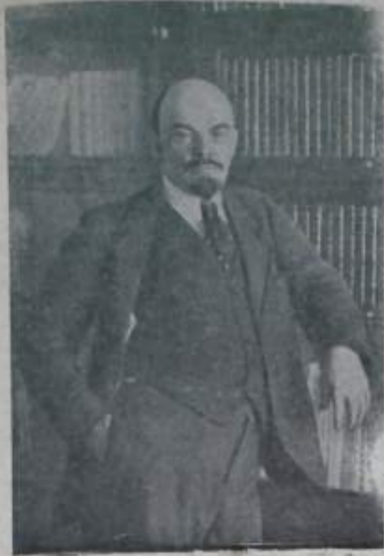
В. И. ЛЕНИН (1918 г.)