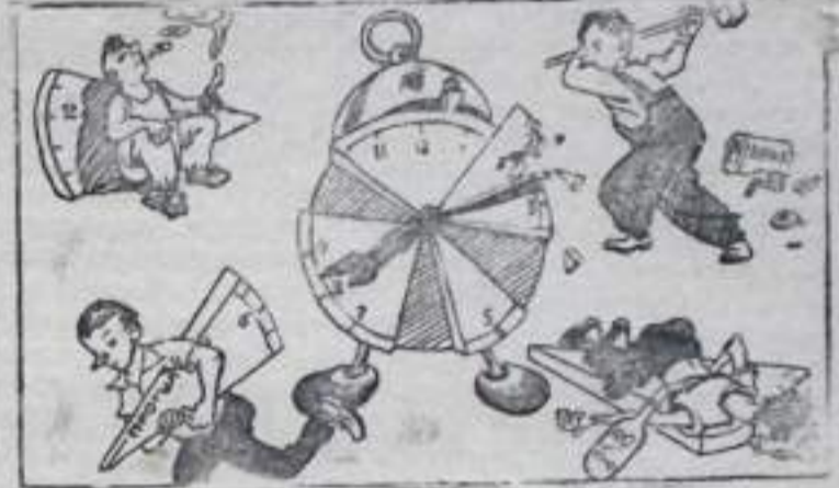
Рахититель рабочего времени.

Послуши распоясавшегося пьяницы и нарушителя производственной дисциплины заслуживают серьезного общественного осуждения и строгого наказания со стороны руководства участка.