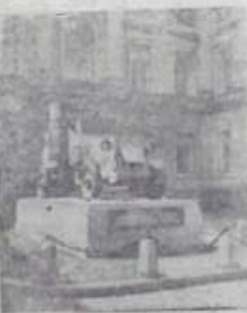
ЛЕНИНГРАД. Броненосец, установленный у входа в музей В. И. Ленина. 3(16) апреля 1917 г. у Финляндского вокзала с этого броненосца прозвучал великий призыв В. И. Ленина «Да здравствует социалистическая революция!»

Сейчас библиотека развернула подготовку и литературному вечеру, посвященному этой славной дате.