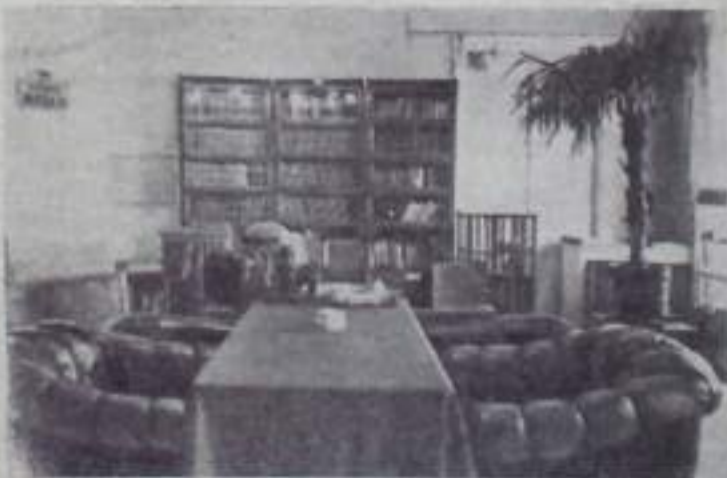
Москва, Кремль. Рабочий кабинет В. И. Ленина