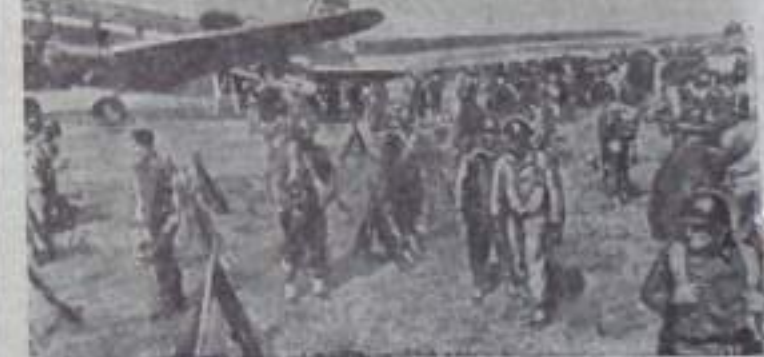
КУБА. Террористический режим диктатора Батисты держится исключительно на штыках армии.

8. Решение вступает в силу через 15 дней со дня опубликования и действует в течение одного года на всей территории города Кумертау.