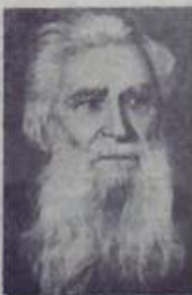
С. Т. КОНЕНОВ, скульптор, народный художник РСФСР.