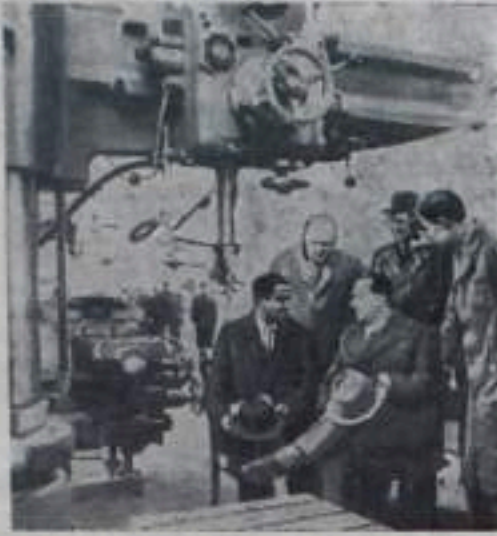
Международная весенняя ярмарка в Лейпциге (ГДР). 1958 год. На снимке: в Советском павильоне. Здесь же, у экспонатов, начинаются деловые переговоры.