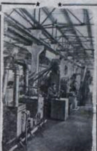
ОДЕССА. На заводе сельскохозяйственного машиностроения имени Октябрьской революции, выпускающем несколько видов плугов, намечено в текущем году увеличить объем производства на 15 процентов, а к 1960 году почти на 50 процентов. Большим техническим прогрессом на предприятии является поиск двух автоматических линий по производству гаек. На автоматической линии по проектированию станков строительной и инструментальной промышленности СССР, установлены станки — машиностроительных заводов Горького, Витебска и Ленинграда. В скором времени войдут в эксплуатацию еще три автоматические линии по изготовлению болтов и гаек. НА СНИМКЕ: участок новой автоматической линии.