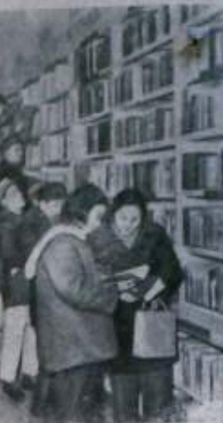
Пекин. В отделе советской литературы на русском языке в магазине иностранной литературы.

В центросберкассе №7722 г. Кумертау начало работы с клиентами с 26 марта 1956 года установлено с 10 часов утра до 6 часов 30 минут вечера. Обеденный перерыв с 2-х до 3-х часов дня, выходной день—понедельник, а по воскресеньям сокращенный рабочий день на 2 часа.