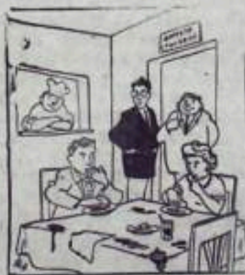
— У вас, видимо, повар хороший: посетители пальчики облизывают? — в нашей столовой вилка и ложка не хватает.