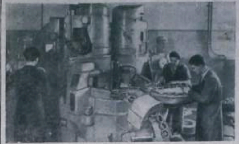
Венгерская Народная Республика. Недавно на Добреценском заводе шарикоподшипников установлен мощный агрегат для закалки колец, полученный из Советского Союза. Новая машина позволит увеличить объем производства шарикоподшипников в 5—6 раз и значительно улучшить качество изделий. В цехах установлены также другие советские машины и станки. НА СПИМКЕ: один из автоматов для обработки колец.