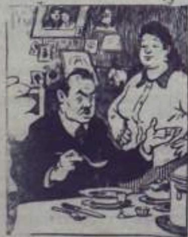
Заведующий столовой, обещая дома.

— Сам ты кислый, — грубо обрывает его повар и зло скрывается за «амбразуру».