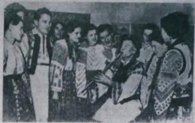
В селах Румынской Народной Республики сейчас насчитывается более 3.600 домов культуры, из читален, красных уголков. НА СНИМКЕ: в доме культуры села Рэкэчуш области Баку. С большим интересом слушает крестьянская молодежь, как их товарищ играет на свирели.