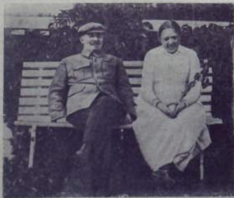
В. И. Ленин и Н. К. Крупская в Горках. 1923 год.

любимицы детворы. С большим интересом рассматривают дети трость из сандалового дерева. Это — дар индийского народа, преподнесенный Ленину в ноябре 1918 года. Пионеры 8-й школы г. Куницево переходят в траурный зал. Здесь они принимают лучших учеников в члены пионерской организации имени В. И. Ленина. Мальчики и девочки кличутся быть верными заветам Ильича.