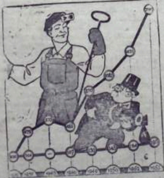
Две линии развития. Рис. К. Едисеева.

(Из доклада товарища Н. С. Хрущева на XX съезде КПСС).