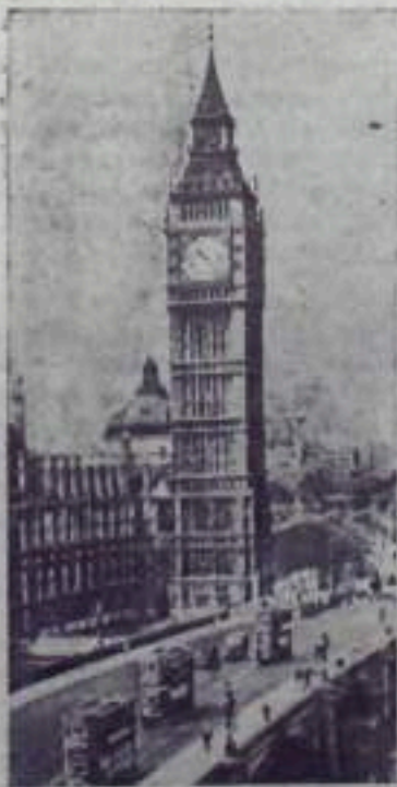
Лондон. Одно из трех зданий английского парламента с башней Биг-Бен.

Сетти Бен Али. Газета пишет, что это убийство, вызвавшее большое возмущение населения, было совершено агентами колонизаторов. (ТАСС).