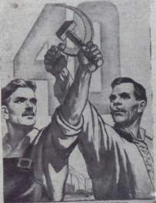
ДА ЗДРАВСТВУЕТ СОЮЗ РАБОЧИХ И КРЕСТЬЯН ОСНОВА СОВЕТСКОЙ ВЛАСТИ!