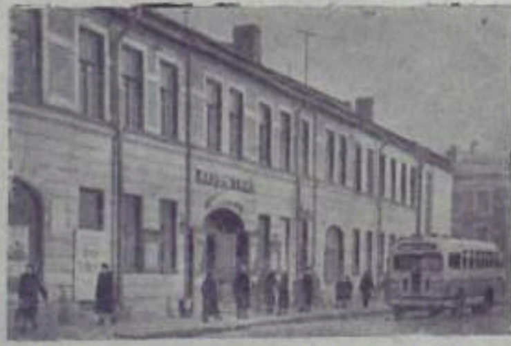
На снимке: дом 37-й по проспекту Карла Маркса. 8 августа (26 июля) 1917 года здесь начал свою работу VI съезд РСДРП