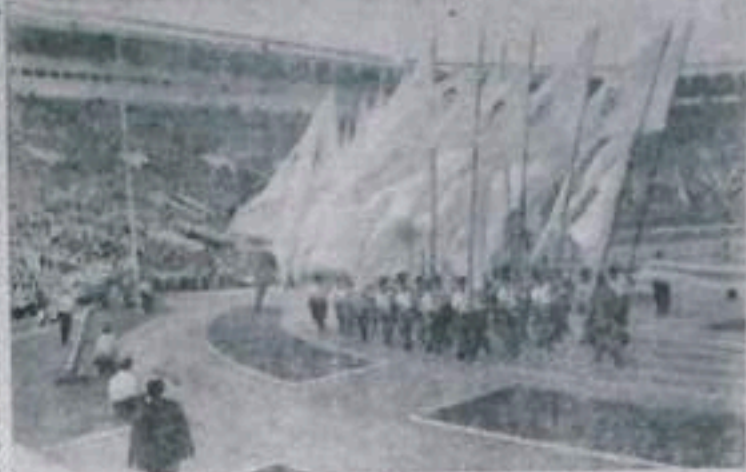
На гербхоз снимке:

Торжественное открытие фестиваля на Центральном стадионе имени В. И. Ленина.