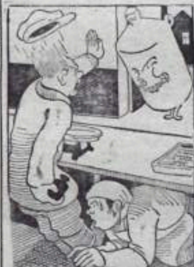
Без приглашения в магазин вдруг появился керосин!...

сильной струей. Возникла опасность затопления квартир водой.