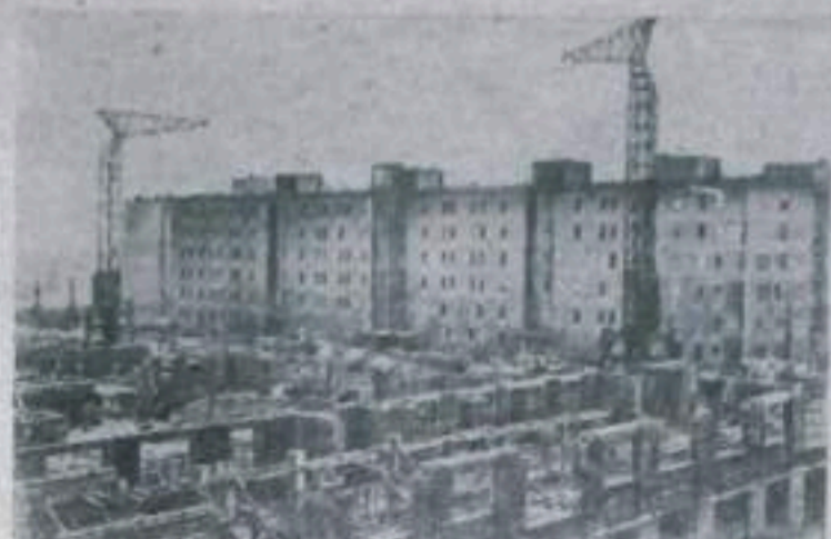
ВЕНГЕРСКАЯ НАРОДНАЯ РЕСПУБЛИКА. В будапеште возводятся многоэтажные дома. Большинство зданий строится с применением сборных деталей. НА СНИМКЕ: общий вид строительства на окраине города.

На углу улиц имени Ленина и Сталина заложен новый жилой дом. Дом будет четырехэтажным и в нем разместится 35 удобных квартир. Сейчас под этот дом роется котлован. Уже вынуты первые сотни кубометров земли.