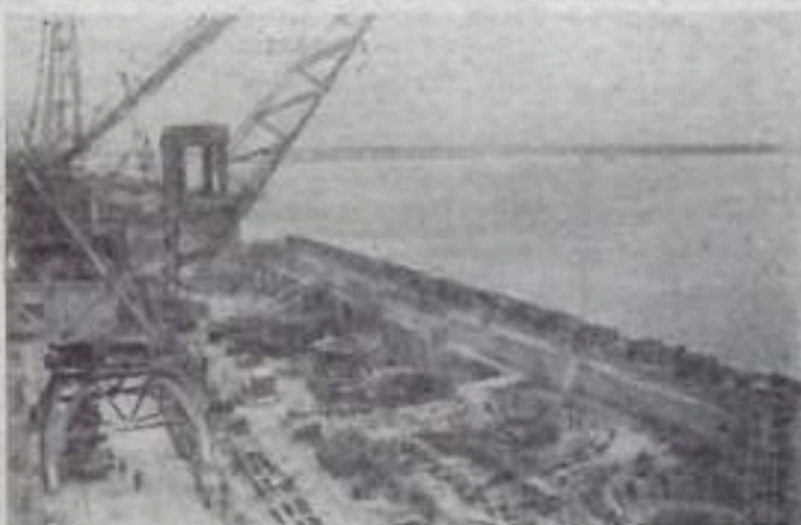
роэлектростанции на Оби. НА СНИМКЕ: общий вид сооружаемого здания ГЭС и части Новосибирского моря.

К 40-летию Великого Октября народное хозяйство Сибири получит дешевую электроэнергию первой гид-