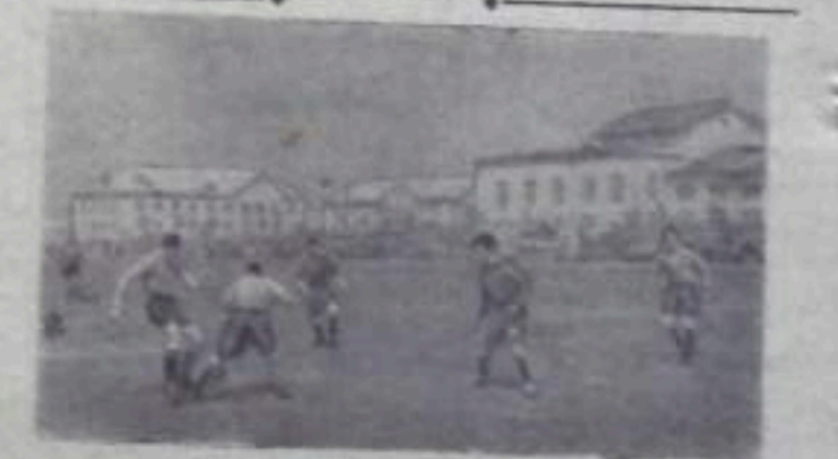
Редактор А. В. ЖУКОВ.

Ермоловской брикетной фабрики требуются на работу каменщики, штукатуры, бетонщики и плотники. Обращаться в отдел кадров фабрики.