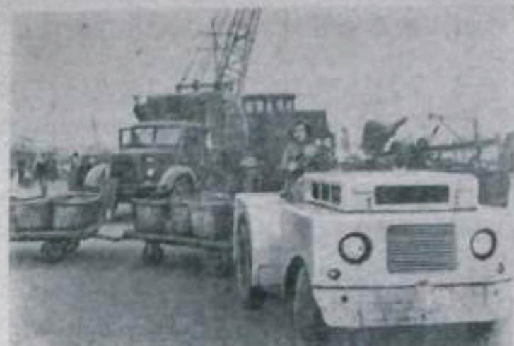
КИТАЙСКАЯ НАРОДНАЯ РЕСПУБЛИКА. До освобождения страны докеры Шанхая жили в тяжелых условиях. Теперь их положение порекомен обрелось. Портовые рабочие живут в хороших квартирах, для них установлена справедливая оплата труда. Если раньше 90 процентов докеров были неграмотны, то сейчас большинство портовых рабочих Шанхая посещают школу.

Изменились и условия труда в порту: здесь применяются различные погрузочно-разгрузочные машины и механизмы, портовые управляют бывшие китовские «кули».