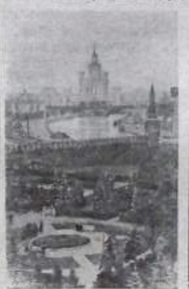
Москва сегодня. Вид на город из Кремля.

Четвертый день VI Всемирного фестиваля молодежи и студентов ознаменовался праздником циркового искусства.