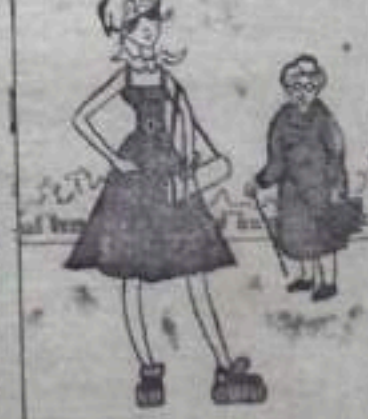
Ужель ты сама Татьяна?! «ГОРНЯК» 3 стр. 9 августа 1967 года.