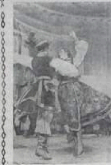
НА СНИМКЕ: выступление танцевальной группы польского Государственного ансамбля песни и танца «Шлеяси» в Концертном зале имени П. И. Чайковского.