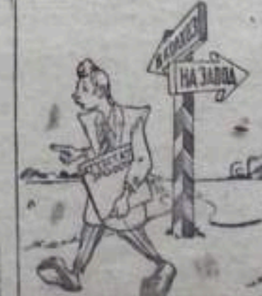
— Здесь везде работать надо. Нет, лучше домой, к маме!