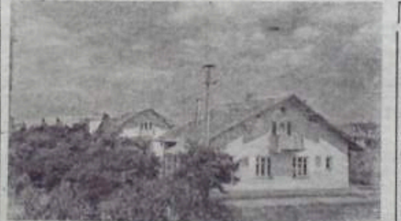
УКРАИНСКАЯ ССР. Многие трудящиеся Львова по пощину горьковчан строят себе сами дома. За последнее время здесь появились новые улицы: Машинистов, Строительная и другие. В районе улицы Пасечной недавно заложены поселок на 100 двух- и четырех- и восьмиквартирных домов. Всего в городе сооружается 2 тысячи квартир. Сотни семей рабочих и служащих Львовского железнодорожного узла и промышленных предприятий встретят 40-ю годовщину Великого Октября в новых домах.