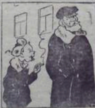
и ..... на улице