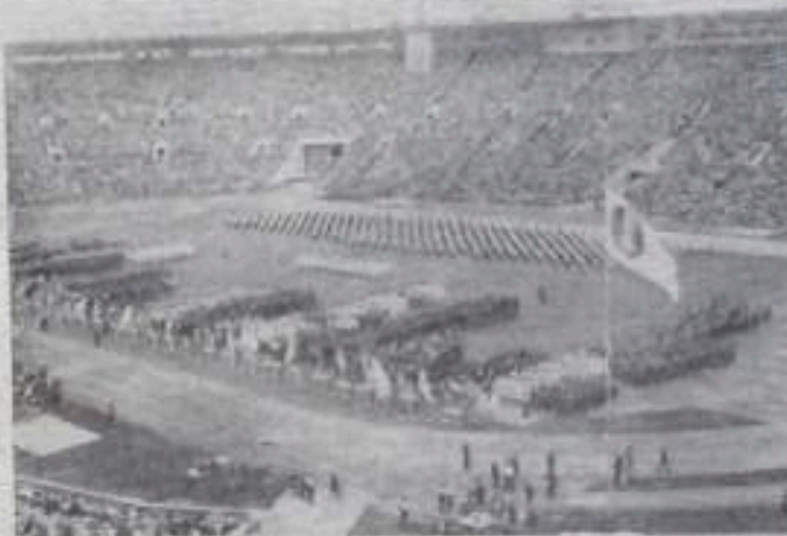
Москва, 29 июля. Открытие III Международных дружеских спортивных игр молодежи на Центральном стадионе имени В. И. Ленина.

На снимке: общий вид стадиона.