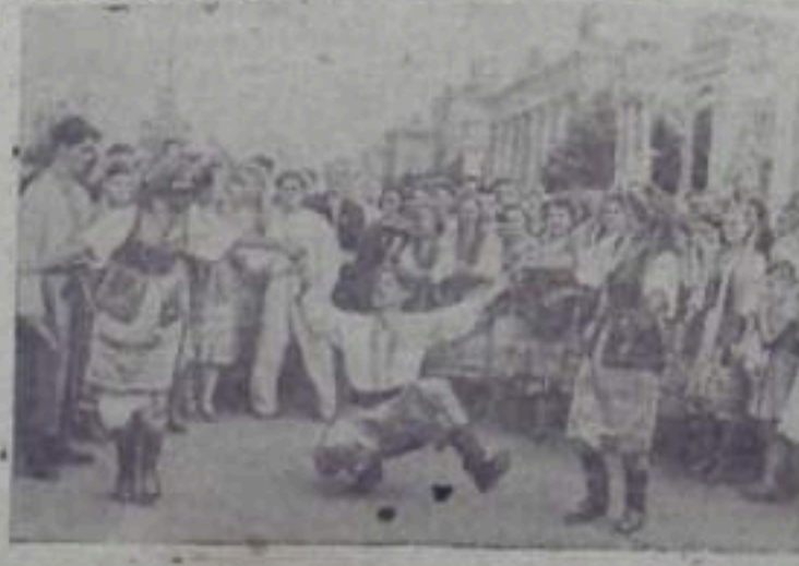
НА СНИМКЕ: гости Фестивала — строители из города Харькова на Всесоюзной сельскохозяйственной выставке.