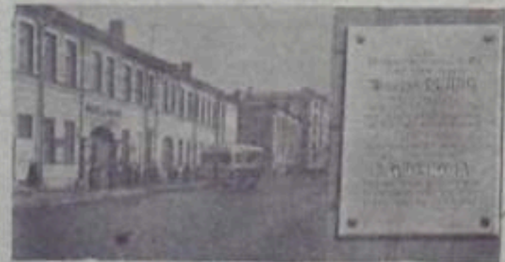
В Ленинграде и его окрестностях много исторических мест, связанных с жизнью и деятельностью В. И. Ленина и с революционными событиями 1917 года. НА СНИМКЕ: дом № 37-а по проспекту Карла Маркса. В августе (26 июля) 1917 года здесь начал свою работу VI съезд РСДРП (большевиков). Теперь в этом здании помещается клуб имени 1 мая.