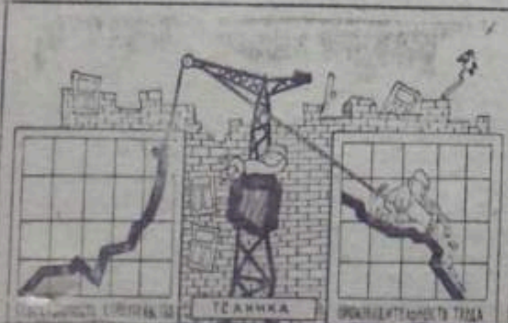
Когда техника простаивает...

Очень часто используются носилки для переноски материалов.