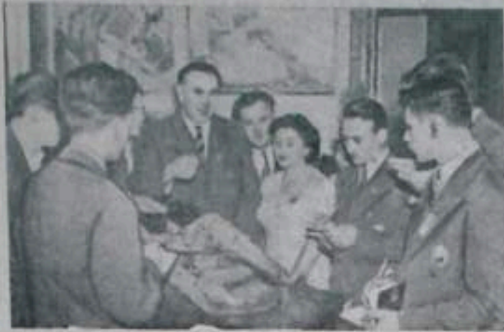
На верхнем снимке:

МОСКВА. В различных залах столами проходят встречи по профессиям и встречи по интересам.