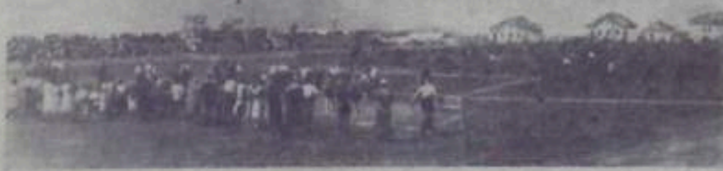
На городском стадионе

Адрес редакции: г. Кумертау, ул. Шахтостроительная, 12. Телефоны редакции и общий редакция через городской коммутатор.