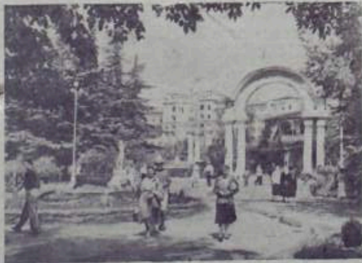
ГРУЗИНСКАЯ ССР. За годы Советской власти широкое развитие получил бальнеологический курорт Цхалтубо. Здесь построены великолепные ванне здания, санатории, комфортабельная гостиница. Кругом разбиты скверы и парки. До революции в Цхалтубо одновременно могли лечиться 130 человек. Они располагались в деревянных домах. В настоящее время курорт имеет 14 санаториев на 2950 мест. Сейчас строится еще 6 санаториев на 1000 мест.

В. Нутува, воспитатель общежития жилищно-строительного.