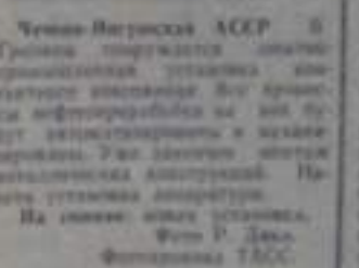
Черныш-Варгасов АССР. В Гурьеве строится завод по производству калийной селитры.

ПЯТИГОРА. Кольца шахтерской борьбы движутся победными шагами. Впервые в истории шахты Кубинской и Прохоровской добыча угля достигла 100 тысяч тонн.