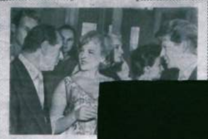
Международный комсомольский центр имени Кавказа...

Вот теперь мы, педагоги, должны быть готовы к этому. Мы должны быть готовы к этому.