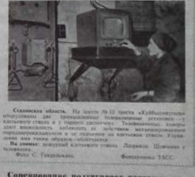
Сталинская область. На шахте № 10 треста «Кубинскоеуголь» организованное телевизионное учреждение.

будут организованы страны для перемены и развития экономики. Каждой бригаде будут поставлены задачи, выполнение которых позволит нам преодолеть трудности, связанные с ликвидацией завала. Исполнение, больше работы смогут быть выполнены, выполнимости заданий.