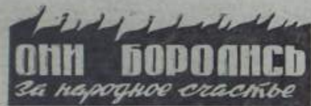
Я. Ф. Фабрициус (в 30-летие со дня победы)

В годы гражданской войны... В. И. Ленин... Письмо к рабочим и крестьянам по поводу победы над Колчаком. 24 августа 1919 года...