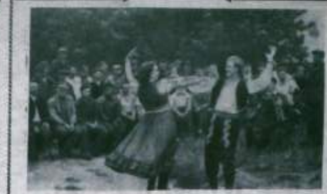
Сталинградская область. Для обслуживания колхозов, занятых на уборке урожая, Нижне-Чирский районный Дом культуры создал физкультурный клуб.

Брось не слова, ничего спортивного, и начал наступать. В этом был Нина с Лешкой на глазах, и начал наступать.