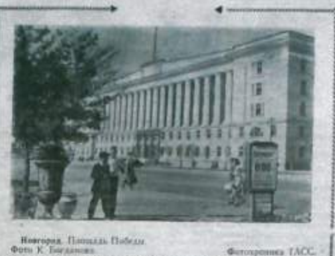
Новгород, Пискарьев Полюс.