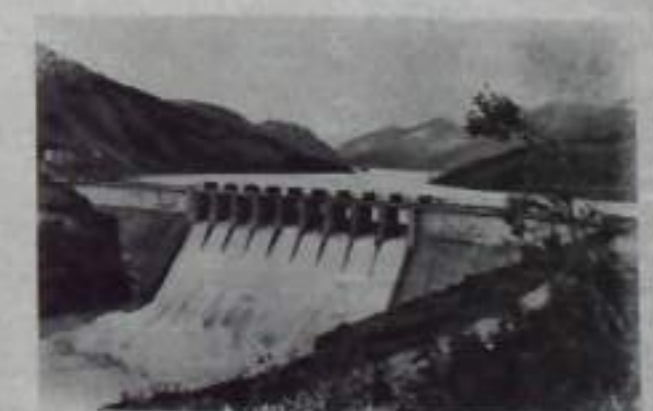
Водоэлектростанция «Старинская» в Болгарии.

Народная Республика Болгария. На южной стороне в горах Восточных Родопов построено самое изобретательное гидроэлектростанционное сооружение Болгарии «Старинская». Строительство гидроэлектростанции «Старинская» велось в условиях самой сложной обстановки. Высота плотины 338 метров в высоту 72,5 метра и составляет водохранилище длиной 29 километров. Здесь построена гидроэлектростанция мощностью 60.000 киловатт.