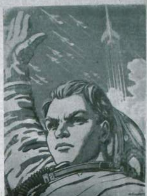
Слава отважным сынам Родины!