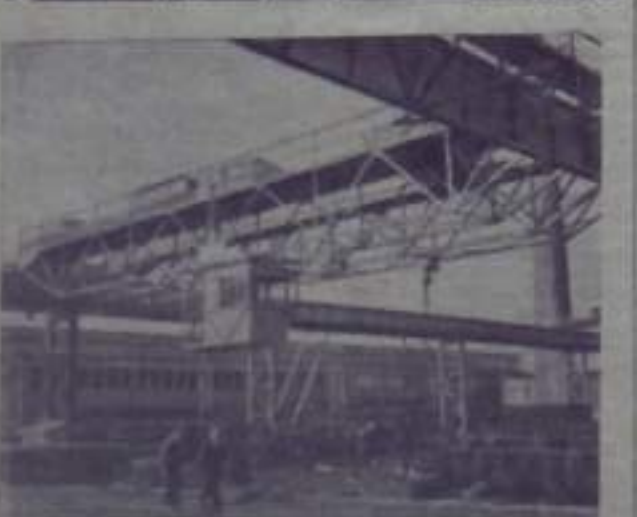
Встреча министров иностранных дел СССР, США, Великобритании и Франции. На первом плане — министр иностранных дел СССР Г. М. Маленков.