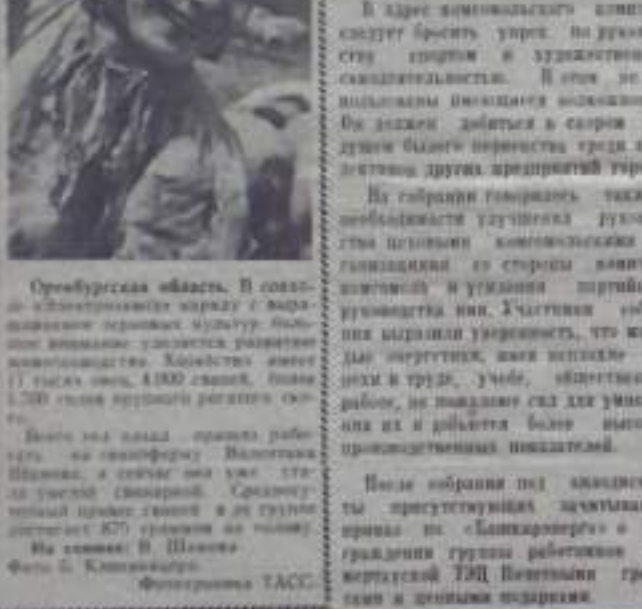
Оренбургская область. В колхозе «Солнечный взлет»...

Особое значение имеет развитие сельского хозяйства. Мы должны быть готовы к этому.