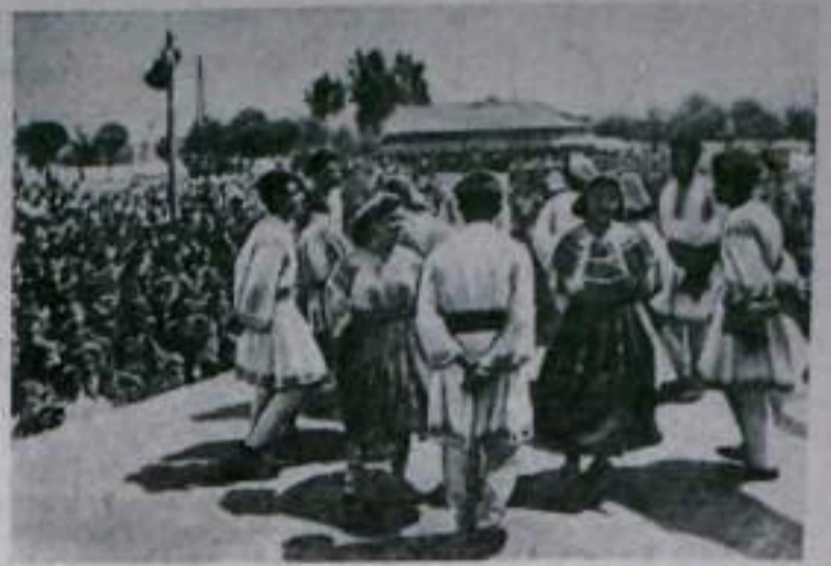
Румынская Народная Республика. Народные гулянья в селе Шолдан Бухаресской области.