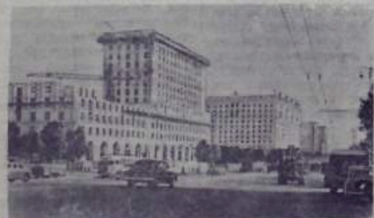
Строительство новых жилых домов на Ярославском шоссе.