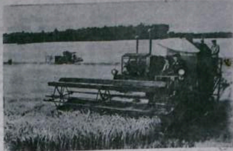
На полях Венгрии идет уборка урожая. На снимке: уборка озимого ячменя в Томпайском государственном хозяйстве.

Американо-английский нажим вызвал глубокое возмущение не только в Египте, но и во всех арабских странах.