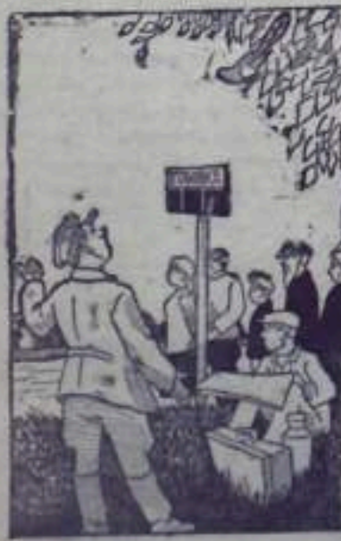
—Прокружи, кукушка, через сколько часов, суток или недель автобус придет?

Автобусы и легковые такси городской автотранспортной конторы продолжают работать неудовлетворительно, расписание их движения не выполняется.