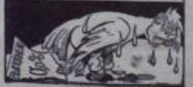
А на деле — мокрая курица.