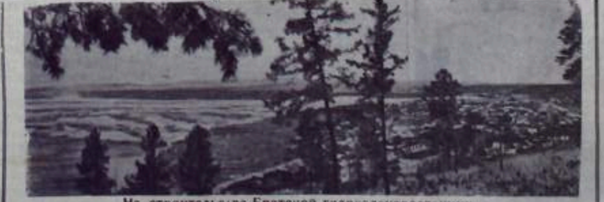
На строительстве Братской гидроэлектростанции. Общий вид временного поселка строителей Цадуи. Слева—Цадуинский порог.