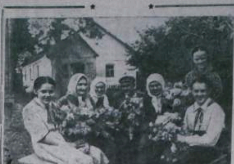
ХМЕЛЬНИЦКАЯ ОБЛАСТЬ. Большой заботой окружены престарелые колхозники в сельхозпункте имени Котляковича Сетовского района. В зимнем году здесь склад дров для престарелых. Сейчас там живут 4 человека, которые обеспечены всем необходимым. В гости к старикам часто приходят пионеры.

секретарь парторганизации брикетной фабрики.