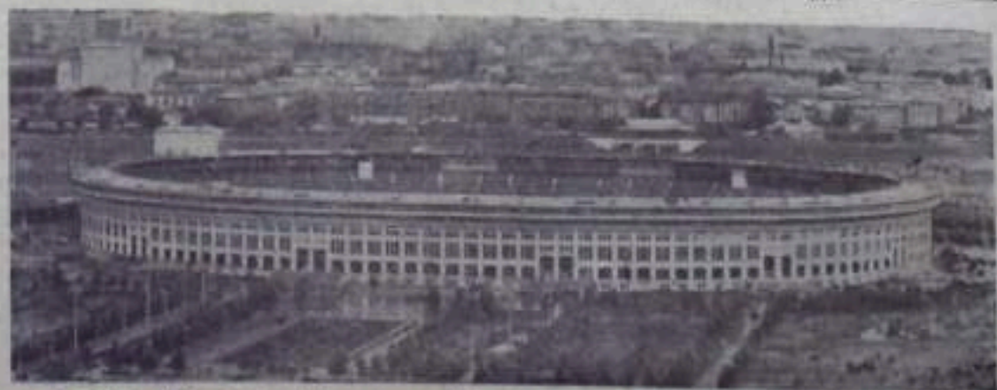
Москва. Центральный стадион в Лужниках. «Большая спортивная арена».