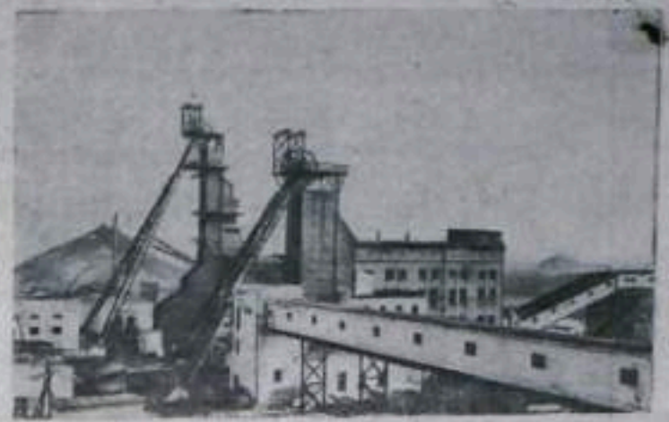
КОМИ АССР. Шахта №40 комбината «Воркутауголь» — действующая шестой пятилетки. Это крупнейшее угольное предприятие в Заполярье. В нынешнем году шахта даст народному хозяйству около миллиона тонн высококачественного угля. За шестую пятилетку в Печорском угольном бассейне будет построено около 20 новых шахт. НА СНИМКЕ: шахта №40.