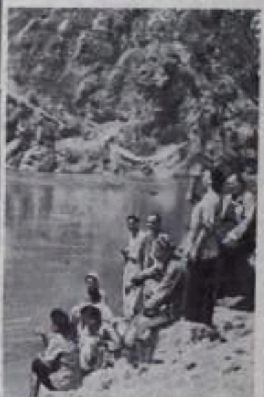
УЗБЕКСКАЯ ССР. В шести санаторных и двух домах отдыха Ферганской области на лето побывало 5000 трудящихся. Большинство этих здравниц расположено в предгорьях Алтайского хребта.

НА СНИМКЕ: в окрестности санатория «Голубое озеро».