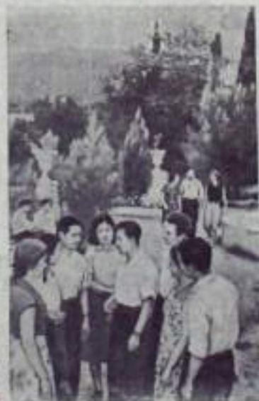
Краснодарский край. На курорте Геленджик действует свыше 30 санаториев и домов отдыха, туристская база, пансионат. Здесь ежегодно отдыхает до ста тысяч трудящихся. Только в санатории имени Ломоносова за лето бывает около двух тысяч человек. Здесь проводят каникулы многие студенты Московского университета и других вузов столицы.