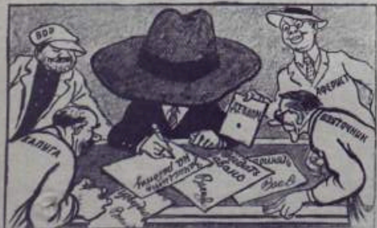
Жульё к советскому рублю. Притягивает деньги. Усех сопутствует жульё, Когда начальство — шельма.

В ОРСе треста „Башкируголь“ пришло немало жуликов. Не случайно поэтому с начала года здесь разорчено и похищено свыше миллиона рублей государственных средств.