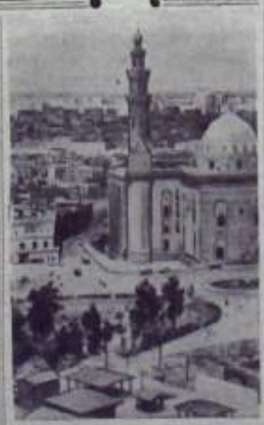
Египет. Вид части города Каира.

работник Кумертауского строительного управления.