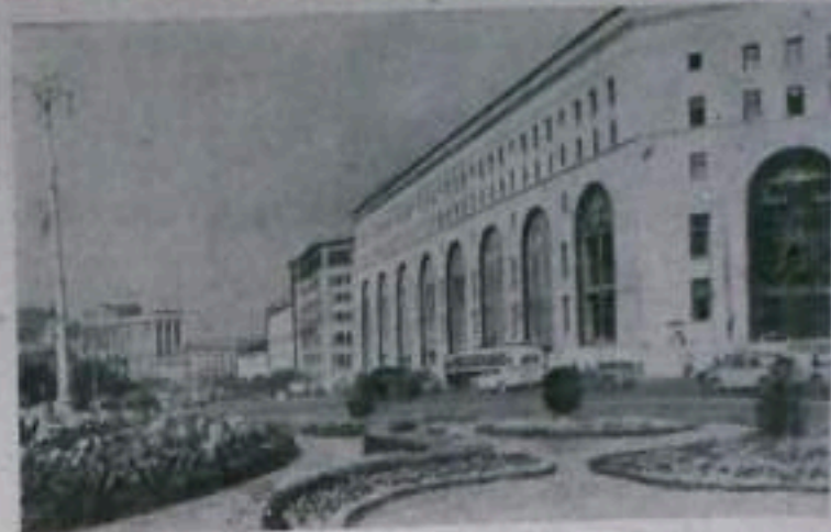
Москва сегодня. Строительство университета «Детский мир» на углу площади Дзержинского и Театрального проезда.

ними. Социалистические страны не боятся соревноваться со всеми, в том числе и с высоко развитыми капиталистическими странами. Социалистическая система не подвержена ни экономическим кризисам, ни анархии производства. Здесь нет безработицы и других пороков, присущих капитализму. Для своего развития социалистическая система не нуждается в войнах, в захватах чужих земель и порабощении их народов. Страны социализма решительно отвергают соревнование в гонимости вооружений. В обращении Верховного Совета СССР к парламентам всех стран о разоружении говорится: «...священным долгом парламентов и прави-