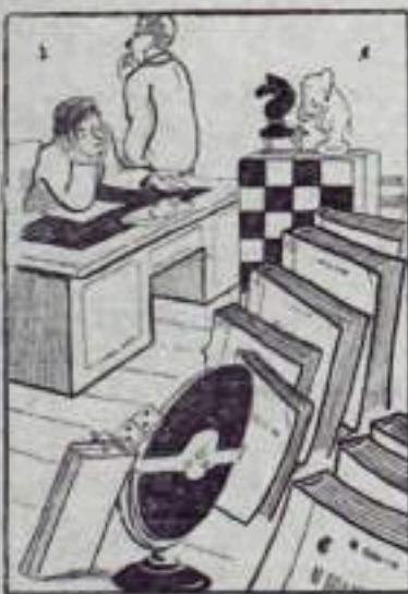
— В общежитиях мы бы газет проводили... да сами дорогу забыли!