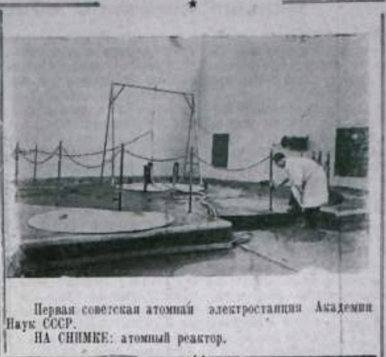
Первая советская атомная электростанция Академии Наук СССР. НА СНИМКЕ: атомный реактор.

Изучая постановления июльского Пленума ЦК КПСС, коллектив бригады единодушно одобряет мероприятия, имеющие целью дальнейший рост производительности труда в промышленности. Мы полны решимости и всемерно, неустанно будем вести борьбу за дальнейший рост производительности труда, чтобы в шестой пятилетке выполнить еще больший объем электромонтажных работ,