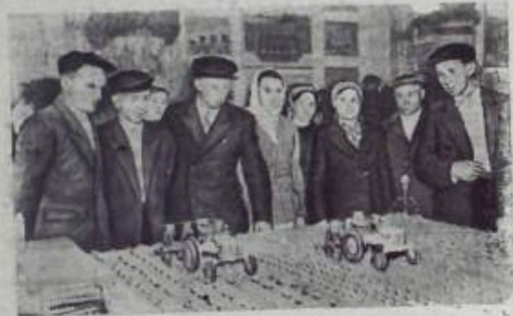
МОСКВА. На Всесоюзной сельскохозяйственной выставке в павильоне Земледелие в этом году экспонируется микет, позволяющий механизацию внесения удобрений в почву. НА СНИМКЕ: экскурсанты из Заокского района Тульской области у микета.