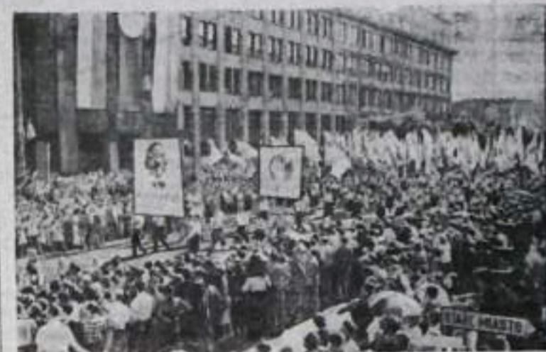
НА СНИМКЕ: участники фестиваля направляются к стадиону Десятилетия.

По окончании торжественной церемонии участники фестиваля с воодушевлением приняли обращение к молодежи всего мира.