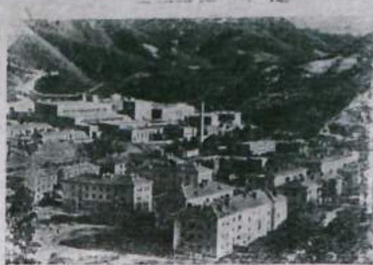
Народная Республика Болгария. Общий вид промышленного города Рудозема в Родопском горнорудном бассейне.