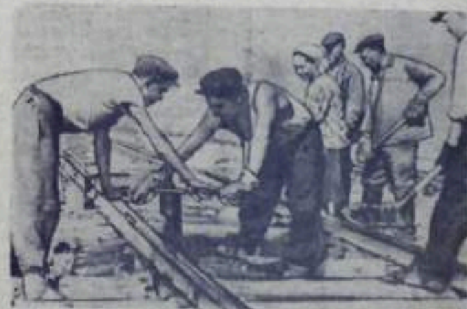
НА СНИМКЕ: Лучшие путевкладчики бригады Филиппова за работой.

К Дню шахтера выполнили годовое задание бригады, руководимые тт. Марьяным, Супуловым, Мартыновым, Виноградовым, Малашиной и звено антисептиков т. Сантовой.