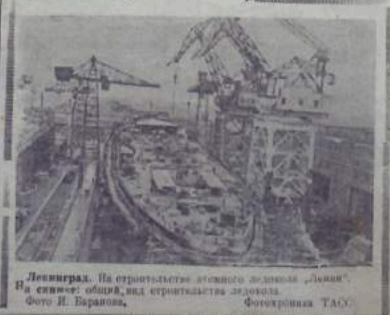
Ленинград. На строительстве нового здания «Ленин». На снимке: общий вид строительства здания.

Виновность подсудимого К... была доказана и народный суд приговорил его к лишению свободы на три года. Однако, в связи с амнистией подсудимый от наказания был освобожден.