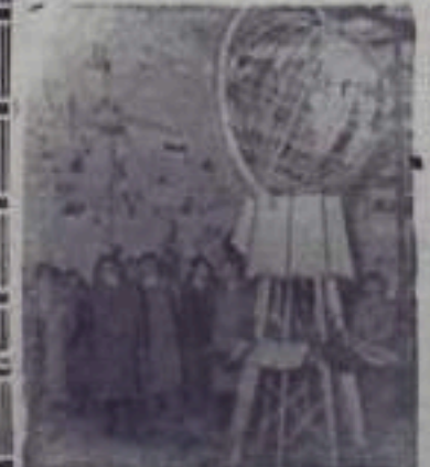
НА СНИМКЕ: в зале выставки.

На выставке экспонируются материалы о румыно-советской дружбе.