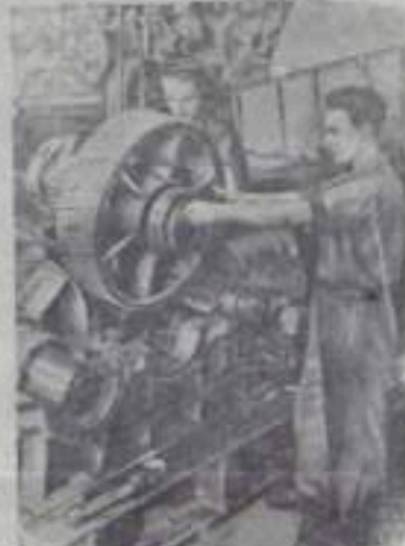
НА СНИМКЕ: слесари Р. Штуклер (справа) и Э. Бартель на контакте агрегата экскаватора. Фото Гессе. Центральный фонд.

Германская Демократическая Республика. Народное предприятие Лауххаммерберг является одним из крупнейших заводов тяжелого машиностроения в ГДР. Оно производит оборудование для угольной промышленности республики.