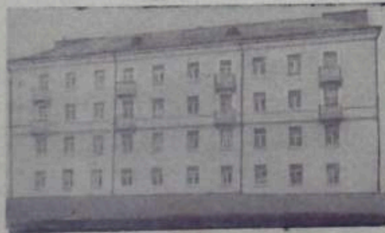
Жилищно-строительные перемены в жизни жилищного строительства. В текущем году строители сдали в эксплуатацию свыше 8 тысяч квадратных метров жилья.