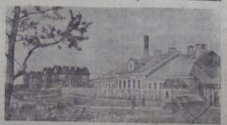
Прутыкская область. В Усть-Куте построена для механизиро- ванных хлебозаводов. Она работает круглогодично и выпускает до 18 тонн хлебных изделий. НА СНИМКЕ: хлебозавод в Усть-Куте.