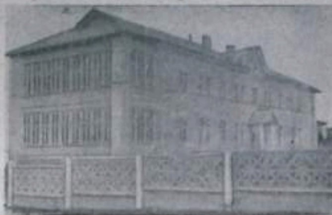
Новое здание детских игр № 6.

М. Нуннин, депутат Верховного Совета РСФСР.