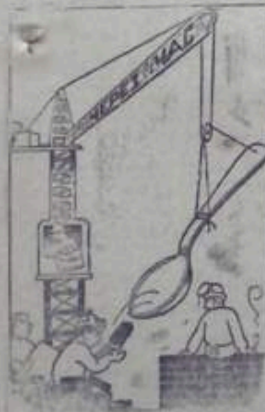
Не по дням, а по годам вырастает стройка.

Несмотря на перевыполнение наших жилищно-строительными организациями планов жилищного строительства, сооружение многих объектов задерживается. Одна из причин этого — плохое снабжение строен лесоматериалами, кирпичом, цементом.