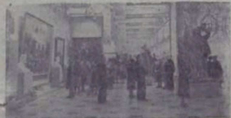
НА СНИМКЕ посетители осматривают Восточную художествен- ную выставку в Москве.