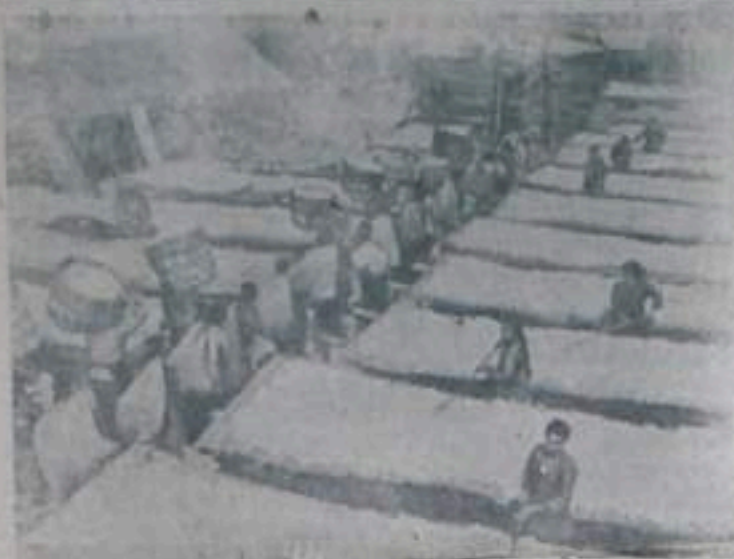
В Катайской Народной Республике идет сбор хлопка. В этом году в провинции Ляонин на северо-востоке страны была неблагодатная пора. Однако коллективный усилки членов агроколхозов и кооперативов дали свои результаты. Была хорошо обработана почва и обеспечен уход за посевами. Многие кооперативы собрали в этом году хлопок-сырец больше, чем в прошлом году. НА СНИМКЕ: члены одного из коллективных хозяйств провинции Ляонин сортируют и сушат хлопок.