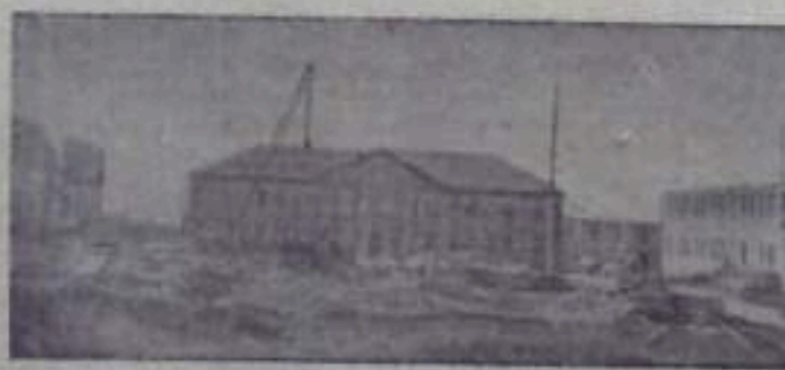
НА СНИМКЕ: строительство дома № 685.

автотранспортом жилстройуправление для перевозки стройматериалов. Но при проверке на местах оказалось, что подаваемые автомашины часто простаивают из-за отсутствия грузчиков, из-за неподготовленности подъездных путей. Факты простоя автомашин подтверждены актами. Работавшие автомашины используются не в полную меру — систематически недогружаются, а это все ведет к удорожанию строительства.