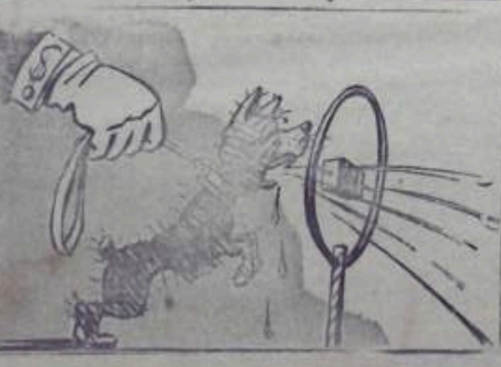
Американский спутник—«Голос Америки» Рис Н. Жирнова