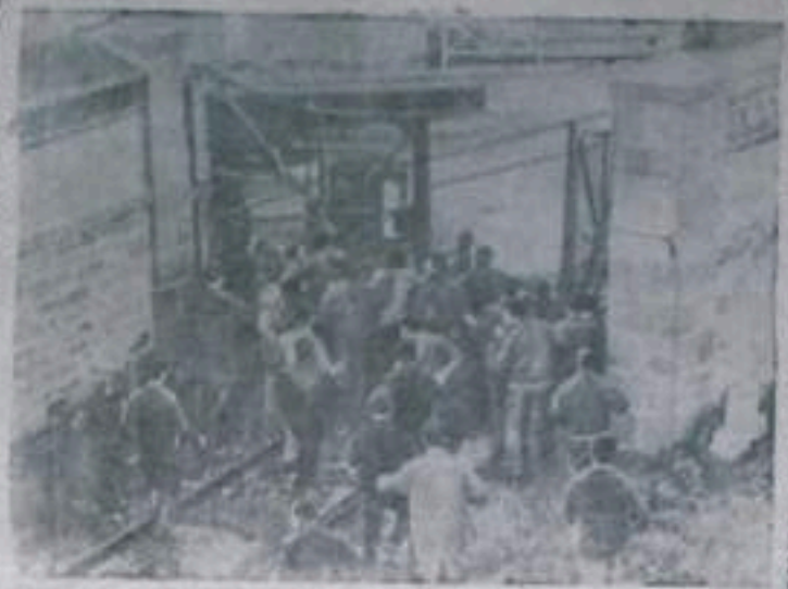
В Триесте затеялось забастовочное движение. Независимо оплачиваемые рабочие, которым судостроительные фирмы отказались повысить «заголовок» плату, пытались вызвать 131 фл. Полная сила разогнала бастующих. На СНИМКИ: бастующие вторгнутся на территорию судостроения.