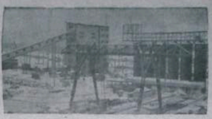
Подъем и возню стеновой рады вылета полевой производственной базы фибры. Это дает возможность при помощи железобетонных стенов, для бетонных стенов 40-метровых стенов 150 метров кубометров. Помимо стенов для вылета железобетонных стенов 40-метровых стенов 150 метров кубометров и т.д. Два дня одно конструкторский выпуск этих стенов. Основ выпуск крупных стеновых блоков, которые уже применяются для сооружения промышленных объектов. НА СПИЖИЛ: завод железобетонных изделий на правом берегу Ангары, один из крупнейших на стройке.