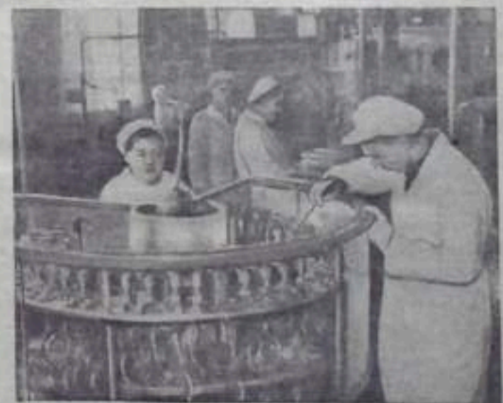
Книголюбивая Народная Республика. Пекинский завод электротехнического оборудования выпускает электротехнические трубы 12 видов, пригодные для радиотехнической промышленности. НА СЭИМКИ: в Китае завода электротехнического оборудования.

кадровых работников. Среди них руководители различных профессиональных и уездных организаций. Ряд институтов и организаций на работу в сельскохозяйственные кооперативы направил в деревню 1090 человек — из числа своих сотрудников. (ТАСС).