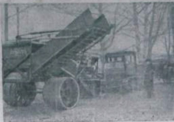
П-тр завод. Механики при погородного совхоза начали Зависа свое устройство оригинальную тоффо обвивающую машину, у которой имеется приспособление для изготовления тоффо-механического типа. Машина работает от 6-радиного электродвигателя «ДТ-24». Новая машина производит за 8 часов до 700 тонн количества, а человек за 10 человек и 200 часов. НА СНИМКЕ: с-структурная машина-автоматом советского типа 3 в ее машина для добычи тоффо и приготовления тоффо-механических изделий.

Принято решение руководствоваться профсоюзным организационным и хозяйственным документами указанным в том, что главное — это забота о человеке. Предложено всем хозяйственникам немедленно устранить серьезные недостатки в охране труда, расширить строительство гардеробных, душевых, повысить культуру на производстве, а также расширить права и поднять ответственность мастеров производственных участков за состояние техники безопасности на их участке. Предложено всем профсоюзным организациям усилить контроль за соблюдением обязательных норм технического обучения, трудового законодательства, за выполнение мероприятий по технике безопасности и производственной санитарии.