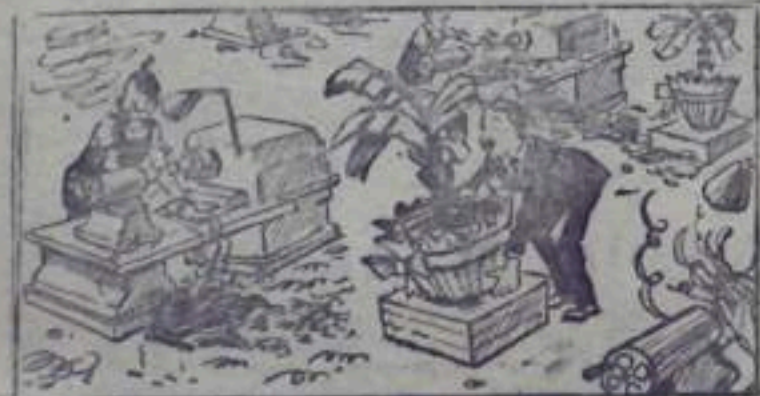
— Вот теперь цех приобрел вполне культурный вид.