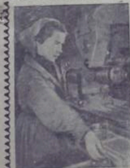
В Старополе заканчивается строительство здания по изготовлению подшипных валов. Над цехом уже возвылся строй. Завод начал выдавать