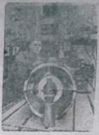
Украинская ССР. Коллектив Харьковского завода «Свет шахт 10» изготовляет «бору» для угольных шахт страны. Здесь, помимо серийных машин, изготавливаются более мощные и совершенные механизмы, в которых уже есть советские горняки. НА СНИМКЕ: федерация колхозников первого пятилетнего пятилетия Украины и ее директор Ново-Олександровского трестостроительного объединения «УС-1». На обороте этой детали он выполнен сменным валиком на 170—180 аршинтов.