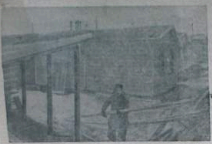
Сталинград. Комбинат промышленных предприятий 52 Сталинградского областного треста изготовляет трехкоординатные химвышковые дома. 35 таких домов установлены для обхода в-он на трассе нефтепровода Жирное - Сталинград и газопровода Саушинское - Сталинград. В 1958 году комбинат в строит более 100 химвышковых домов для колхозных зеленых степей. НА СНИЧКЕ: строительство намышпных домов.