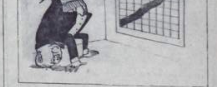
Рис. В. Савкова. Фотохроника ТАСС.