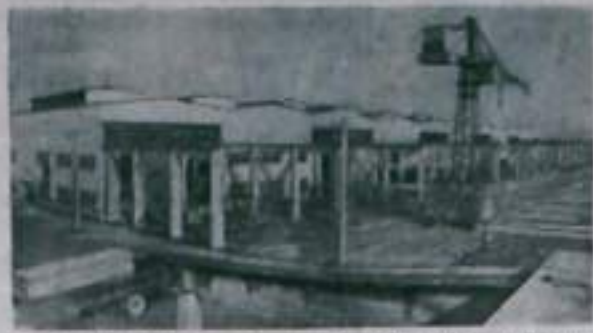
Ташкент. Вступила в строй первая очередь комбината крупномасштабного домостроения. Прогрессивные методы будут использоваться также в строительстве помещений и деталей, камен и кирпича для строительства домов общей площадью 100 тысяч квадратных метров.