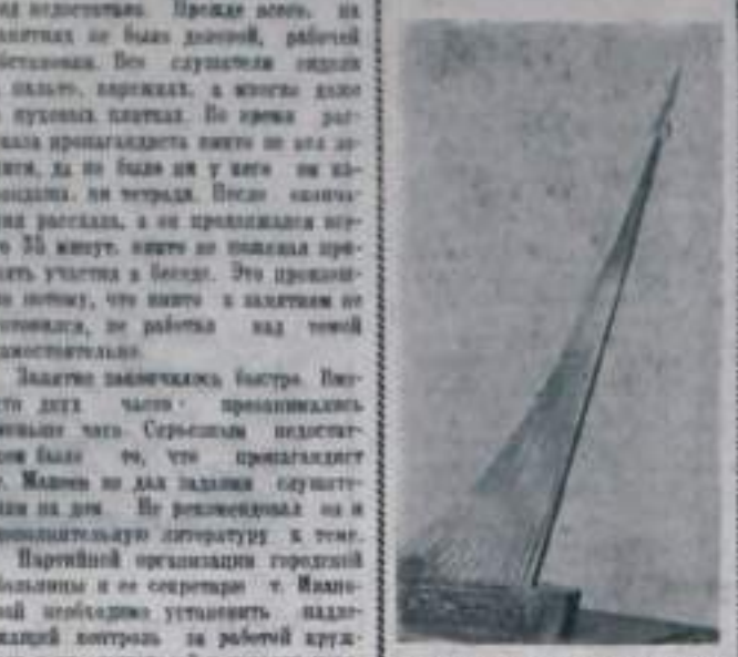
По постановлению Советского правительства в Москве будет сооружен обелиск в ознаменование запуска в Советском Союзе первого в мире искусственного спутника Земли.