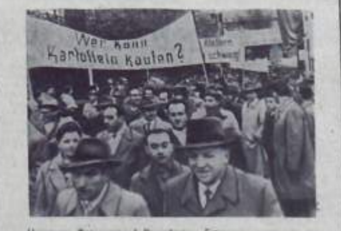
На снимке: демонстрация в Мадриде — столица Испании. Люди выкрикивают лозунги в поддержку социализма.

Могущество стран социализма — залог прочного мира. Это не просто так. Это серьезное предупреждение, которое должно быть услышано всеми. Пора найти виновника, пора найти виновника. Вот еще один пример. Группы комсомольцев работают в школах, помогая учителям в воспитании учащихся. Они проводят различные мероприятия, направленные на повышение культуры и навыков учащихся. В комсомольской организации необходимо укреплять дисциплину, воспитывать ответственность и активность каждого комсомольца. Для этого необходимо совершенствовать методы и формы работы, использовать все возможности комсомольской организации.