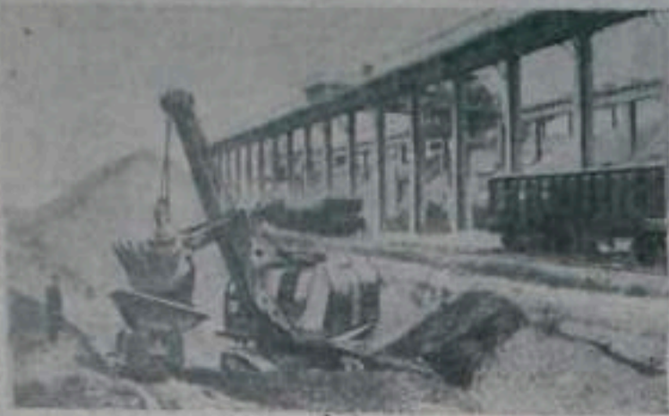
СТАЛИНСКАЯ ОБЛАСТЬ. Трудящиеся Енакиевского цементного завода решили дать стройкам Донбасса до конца года 5.500 тонн сверхпланового цемента. Свои обязательства они успешно выполняют. Все работы на сырьевом складе завода полностью механизированы. НА СНИМКЕ: на сырьевом складе цементного завода.