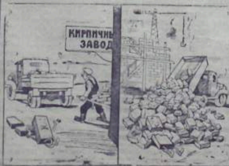
Как мало прожито...

С выставочных площадок Мелеузовского и Пятковского кирпичных заводов кирпич отправляется на стройки без контейнеров и поддонов. Много кирпича портится при транспортировке и еще больше бьется при разгрузке на стройплощадках.