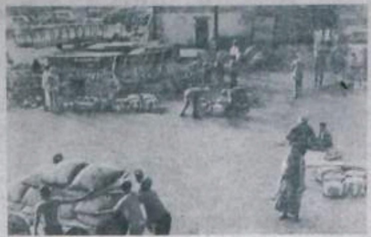
Западная Африка. Сенегал. Грузчики-негры в порту Дакар.