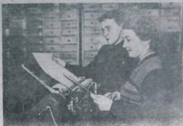
УКРАИНСКАЯ ССР. При Киевской МТС работает первая в стране сельская машинно-счетная станция, созданная по образцу счетных станций промышленных предприятий. Учет труда механизирован во всех волкозах, обслуживаемых машинно-тракторной станцией, что позволило освободить от счетной работы и перевести на производство 40 бригадных учетчиков. Союзный штат конторских работников, колхозы сэкономили за год около 12 тысяч трудовых дней.