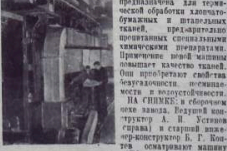
Иваново. На заводе текстильного машиностроения закончена сборка машины «АТО-110». Она предназначена для термической обработки хлопчатобумажных и штапельных тканей, предварительно пропитанных специальными химическими препаратами.

НА СНИМКЕ: общий вид полуавтоматической линии.