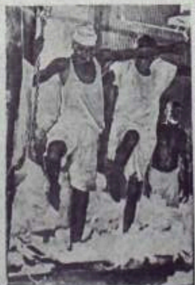
Судан. В цехе хлопкоочистительной фабрики в Меркване.