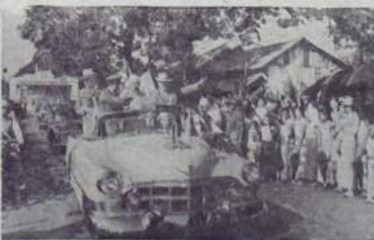
Пребывание Председателя Совета Министров Союза ССР Н. А. Булганина и Члена Президиума Выходного Совета СССР Н. С. Хрущева в Бирманском Союзе.