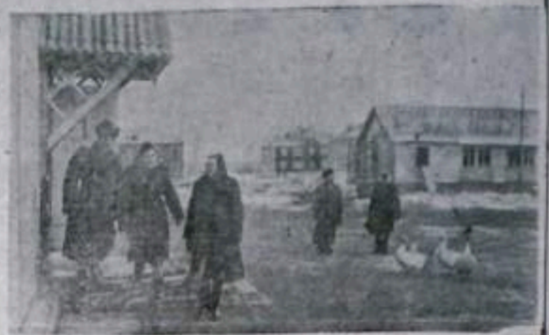
В новом совхозе «Дергачевский», Саратовской области, основанном на целинных землях, сооружено около тридцати жилых домов, столовая, баня и другие помещения. В ближайшее время здесь начнется строительство больницы и школы. На территории центральной усадьбы совхоза 2,5 гектара сада площадью в семь гектаров. На снимке: центральная усадьба совхоза «Дергачевский».