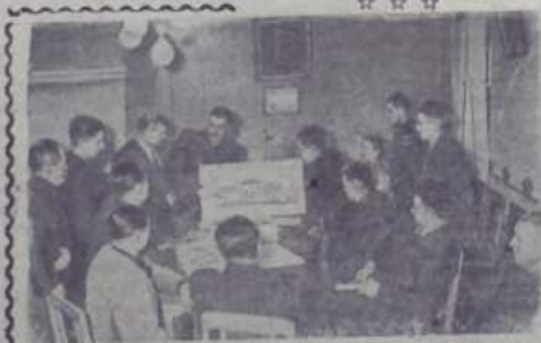
ОДЕССКАЯ ОБЛАСТЬ. Годовой доход сельхозартели «8 марта» Новочивновского района составляет почти 15 миллионов рублей.

Д. Суелов, секретарь партбюро Ермолаевского шахтостроительного управления.