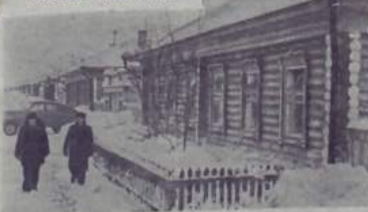
СВЕРДЛОВСКАЯ ОБЛАСТЬ. Металлургия Серовского завода построили своими силами 43 жилых дома общей площадью 3,800 квадратных метров. Сейчас заложены фундаменты еще 55 домов.