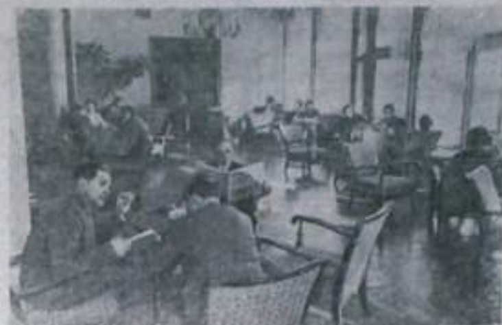
Венгрия. В горах Матры вновь открыт Дом отдыха совета профсоюзов «Гангеве». Сейчас в нем отдыхает около 250 рабочих и служащих.