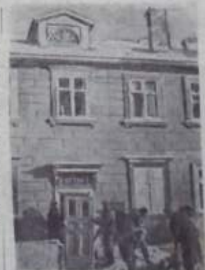
КУСТАНАЙСКАЯ ОБЛАСТЬ. Широко развернулось жилищное строительство в агро совхозе «Московский» Кустанайского района. Здесь построены 84 дома, имеющие 4 тысячи квадратных метров жилой площади. В июне будет сдано еще 500 квадратных метров жилья.

НА СПИМКЕ: строительство восьмиквартирного дома в совхозе «Московский».