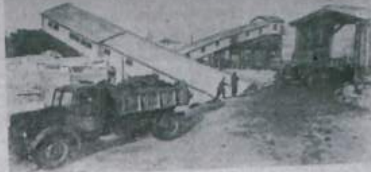
ИРКУТСКАЯ ОБЛАСТЬ. В Череховском угольном бассейне все более широкое распространение получают открытые разработки угольного месторождения. НА СНИМКЕ: технологический комплекс южного разреза, построенного на горных отводах шахт № 5 и № 6. Себестоимость угля на этом разрезе в два раза ниже, чем при добыче подземным способом.