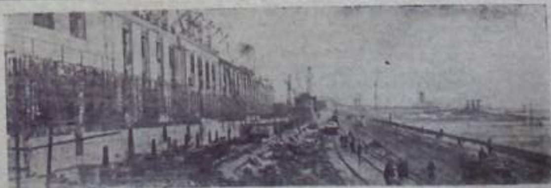
НА СТРОИТЕЛЬСТВЕ КУЙВЫШЕВСКОЙ ГЭС. Наряду с постройкой административного здания ГЭС, водосливной плотины и шлюзов сейчас ведется прокладка шоссе и железных дорог через основные гидротехнические сооружения.

ли дали наказ больше заботиться о нуждах трудящихся, живее откликаться на их запросы. Было отмечено, что некоторые депутаты городского Совета не встречались со своими избирателями, не отчитывались перед ними. В связи с этим был дан наказ кандидатам чаще встречаться с избирателями.