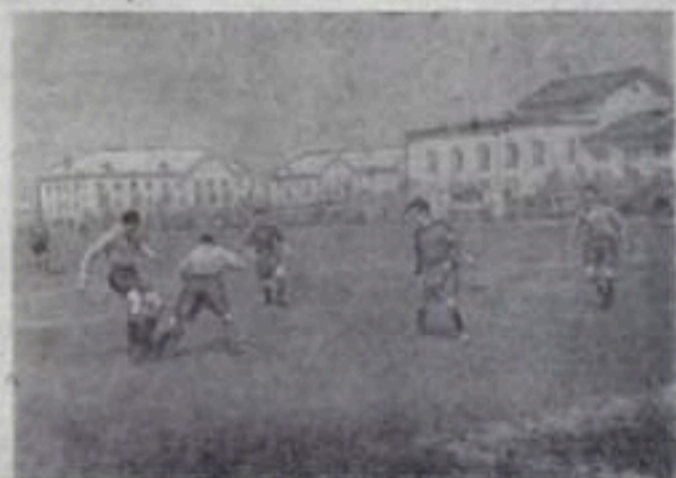
НА СНИМКЕ: встреча футбольных команд ТЭЦ и Ермолдавского разреза.