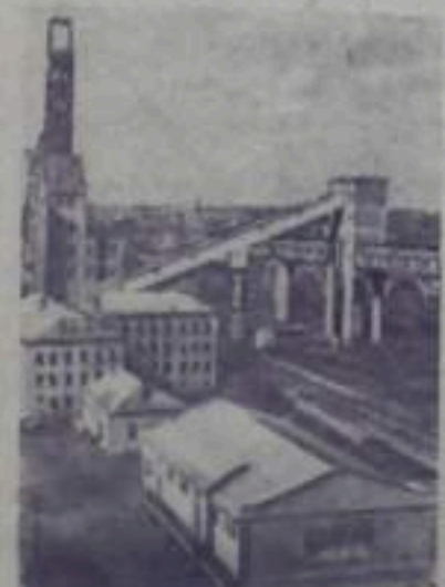
ДНЕПРОПЕТРОВСКАЯ ОБЛАСТЬ. В Кривом Роге на дне реки Саксагань и ее берегах находится большие запасы железной руды. Чтобы приступить к ее добыче, надо было отвести реку от рудных залежей. С этой целью криворожские шахтостроители проложили пятикилометровую тоннель. На базе Саксаганьского месторождения создается несколько мощных карьеров с открытым способом добычи руды. НА СНИМКЕ: новая шахта «Саксагань» на рудные копи Дзержинского треста «Дзержинскруд».