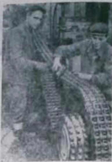
развернулось социалистическое соревнование. Решено пройти и закрепить клетевой ствол к 40 в годовщине Великого Октября — на три месяца раньше срока и сэкономить сверх плана 300 тысяч рублей. Это обязательство успешно выполняется. График работ значительно опережен. Экономлено 200 тысяч рублей.

Главный инженер монтажного управления т. Макаров по этому письму сообщил, что канализация выполнена по проекту, но в настоящее время часть колодцев разрушена и засыпана в связи с устройством путей для крана СБК у строящихся домов в кварталах 13-15. После уборки крана колодцы будут восстановлены, очищены и линия вступит в работу.