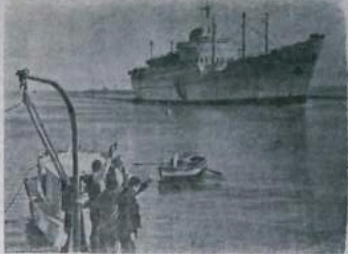
ЕГИПЕТ. Оживленно сейчас на Суэцком канале. Ежедневно в оба направления по каналу проходят десятки судов под флагами многих стран мира. Объем судоходства по каналу уже почти достиг уровня, существовавшего до англо-франко-израильской агрессии.