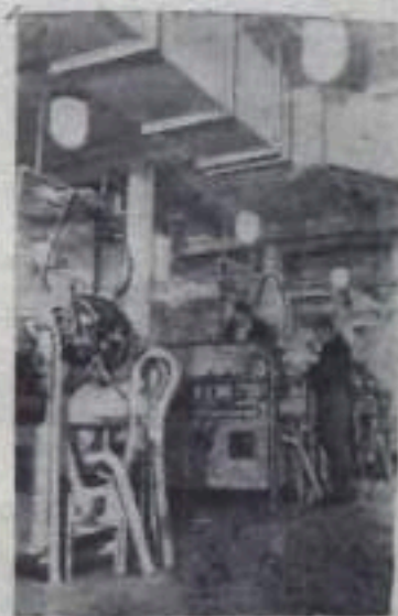
Антарктида. Машинный зал электростанции поселка Мирный.