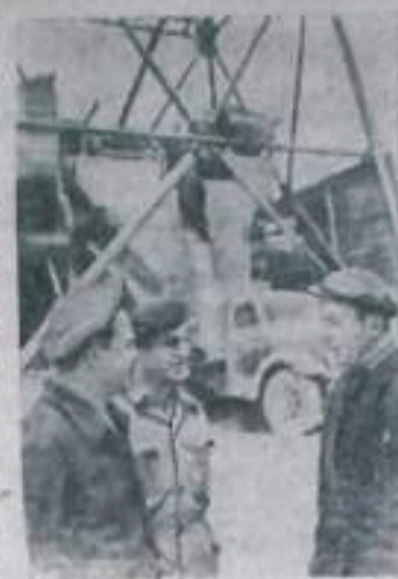
ПРИМОРСКИЙ КРАЙ. Шахтостроители Артемовского строительного управления треста «Дальшахтострой» при проходке Северного ствола шахты 3-й впервые в Приморье применили параллельный способ проходки — они одновременно ведут проходку ствола и возведение постоянного крепления. Это позволило увеличить