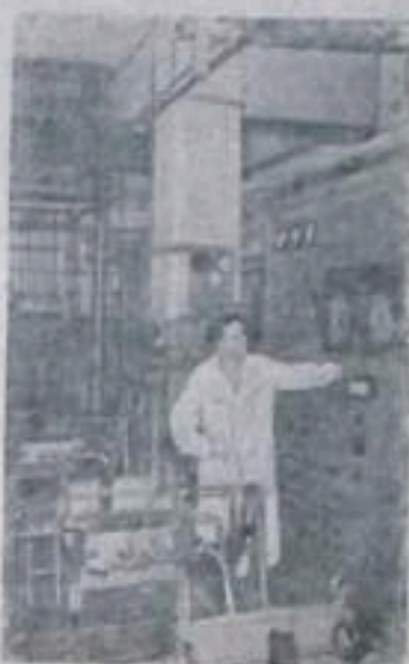
новый коллектив станции охотно и предупредительно передает свой богатый опыт, да и не только им. В Омске проходит подготовку специалистами ряда зарубежных стран, и в частности, братского Китая.

Три года работы станции показали надежность и универсальность всех ее узлов, сертифицированных советскими учеными и сделанных руками советских рабочих на отечественных заводах. Она становится теперь школой и лабораторией для строителей новых атомных энергетических станций, которые сооружают советские люди, исполняя директивы XX съезда Коммунистической партии. Для этих станций здесь готовятся кадры высшей квалификации в атомной энергетике.