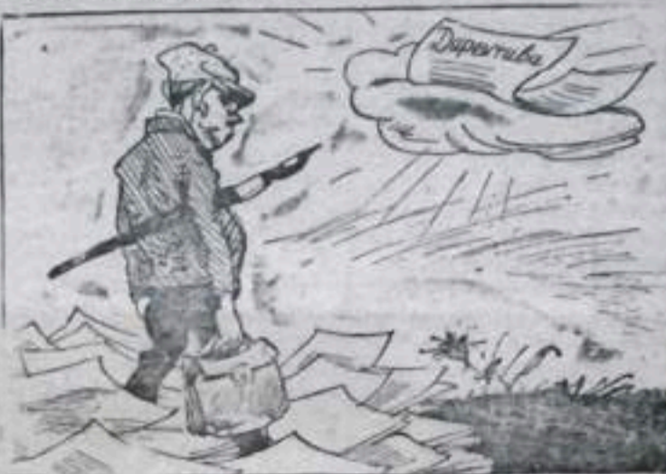
В ожидании директивы, Словно мяпопаямый стоит И как будто стол спит.

В угольных разрезах и на отдельных предприятиях комбината «Вашкируголь» не выполняются мероприятия по подготовке к работе в осенне-зимних условиях. Отдельные хозяйственники рассуждают так: «Лето еще не ушло. Зачем спешить? Вот будет директива из комбината или Совнархоза тогда и разберемся!»