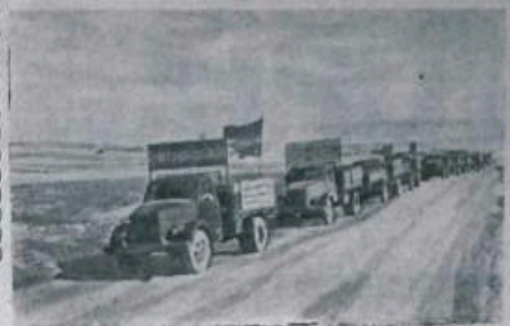
УЗБЕКСКАЯ ССР. В колхозах и совхозах республики идет массовая уборка зерновых. На полях совхоза «Ударник» Заманьинского района Самаркандской области работает более 50 комбайнов. Механизаторы на уборке урожая успешно применяют следом за комбайном. На очистке и загрузке зерна здесь широко используются зернопульта, зернопогрузчики и другая новейшая техника. Совхоз уже отправил на элеватор первые автоколонны с хлебом нового урожая.

НА СНИМКЕ: автоколонна совхоза «Ударник» направлена на элеватор с хлебом нового урожая.