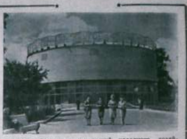
Москва. Выставка достижений народного хозяйства СССР. Здание круговой киноопоры.