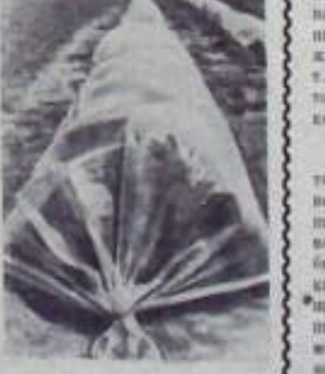
Венгерская Народная Республика. На учебном учебном хозяйстве Будапештского института орудийности и конструкторства для выпаривания сапонины при помощи горячей воды. Это позволяет значительно сэкономить большие средства, которые раньше шли на покупку сырья.