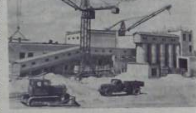
Белорусская ССР. В Минске сооружается завод, который войдет в состав объединения крупноблочных конструкций...