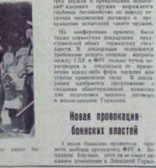
Содетинские Штаты Америки. Полицейский разгонит митинг студентов работников кино-вирского фильма.

Обеспечить мирное будущее народов Европы