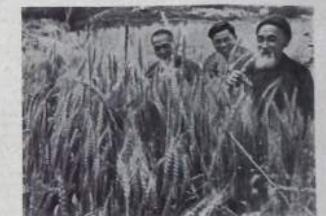
Катяйвас Народная Республика. В народном институте Чифу в уезде Ниншань (провинция Сичуань) соревнуются студенты уржай олимпиады.

«Честный труженик, активный производитель, — отзывались о нем на заводах.