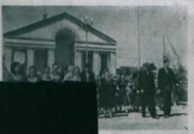
В ходе работы комиссии ЦК КПСС по проверке хозяйства СССР. Встреча с работниками завода «Красная звезда».

Полноценная работа об участии граждан в контроле за деятельностью администрации на предприятиях и в учреждениях. В частности, руководителем предприятия является назначенный администрацией.