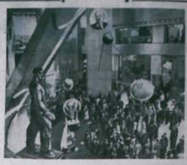
Нью-Йорк. В крупнейшем выставочном зале Нью-Йорка «Коллизей» открыта выставка достижений Советского Союза...