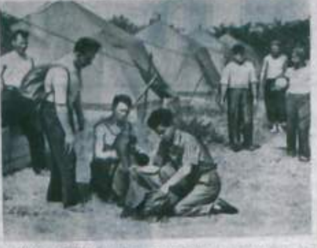
Тульская область. В Дедовском районе для германского треста «Красинградбашурталь» старые туристические лагеря. Здесь одновременно проводят отпуск 100 человек.