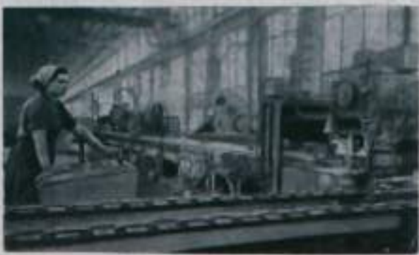
Днепропетровск. Работники завода металлургической конструкции имени Бабушкина следят за процессом заливки бетона в опалубку. В центре — механизированный трудящийся производственный процесс. Завершается оборудование второй линии для обработки полуфабрикатов из углеродистой стали. Механизированы все транспортные операции. На снимке: один из участников второй линейной линии.

Как известно, в Советском Союзе на протяжении ряда лет ведется систематическое исследование верхних слоев атмосферы с помощью многоступенчатых баллистических ракет на различных высотах. В ходе ранее произведенных пусков были получены весьма ценные научные материалы, по-новому освещающие состояние верхних слоев атмосферы и происходящие в них процессы, о чем сообщалось ранее в печати. 2 июля 1959 года в 6 часов 40 минут по московскому времени произведен очередной пуск одноступенчатой геофизической баллистической ракеты средней дальности, в соответствии с планом научных работ по исследованию верхних слоев атмосферы. Ракета была оборудована аппаратурой для изучения ультрафиолетовой части солнечного спектра, структуры ионосферы, микрометеоритного потока, направления скорости воздушных течений на различных высотах, а также аппаратурой для определения плотности, давления, температуры и состава атмосферы по высотам. Для изучения жизненных функций живот-