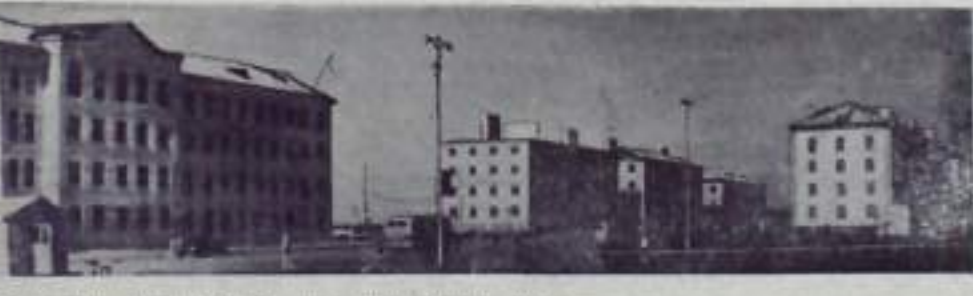
С каждым годом все шире идет строительство города Коммуниста. За последние два года на улицах имени Ленина и Сталина выросли новые дома с благоустроенными квартирами. На снимке: строительство четырехэтажного дома по улице им. Сталина.

АТМА-АТА. Циклонная — так была названа с трубками индийского Пленума ЦК КПСС новая, изобретенная печь. Ее применение сулит переход в металлургии. Печь разработала ученый Академии наук Казахстана. Первая полутораметровая установка прошла недавно испытания на Байконурском горно-металлургическом комбинате. Испытания показали, что циклонная печь подается более сырье, а производительность повышается при этом и на 80 раз. Все процессы в установке механизированы и автоматизированы. Новый способ плавки позволяет неслучайно лучше извлекать из концентрата металл.