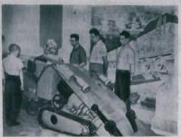
Москва. Выставка достижений народного хозяйства СССР. В павильоне «Украинская ССР». Посетители осматривают новую модель автомобиля «МАЗ-14», выпускаемую Днепродзержинским заводом автомобильных агрегатов. Эти машины, применяемые для перевозки груза в шахтах, позволяют значительно увеличить производительность труда шахтеров.

П. ЕРНКОВ, исполнительный редактор ЖКО комбината «Банкиргорьел».