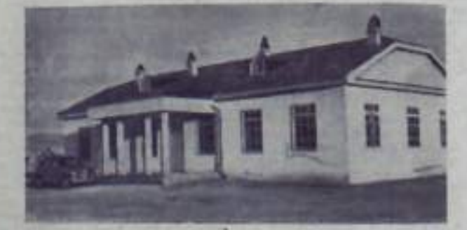
Министерство Народной Республики. В г. Гельзенкирхен...