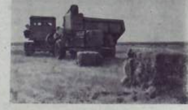
Автомобильная область. В колхозе № 40 лет Октябрьского района за последние несколько лет построено несколько новых машин. Сельские механизаторы успешно ведут подготовку трактористов-машинистов.

В июне участились случаи краж велосипедов. Отдельные жители приносили сообщения о кражах велосипедов. В результате такой «профилактики» были выданы и задержаны любители чужого добра.