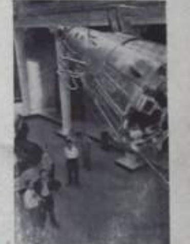
Москва. На Выставке достижений народного хозяйства СССР. В одном из залов показана Академия наук СССР. Модель третьего советского искусственного спутника Земли в натуральную величину.

другие смены кирпичника. Выпалить норму — это задание обременен, будущим в жизни формовщика. Наоборот, здесь речь идет только о перекачку в 27 тысяч, 28 и даже до 30 тысяч в июне дни дойдут выработка в сменах. У наших мастеров изощренный, но здоровый спор. Спор тружеников, боевики за дело всего производства, — говорит главный инженер завода т. Румбанин. Именно этот энтузиазм, поразительный широкий размах свершений в борьбе за семилетний план, творческое участие всего коллектива в производстве автоматизации позволили кирпичникам к 24 июня, две начала работы Пленума ЦК КПСС, rapporter в выполнении плана первого полугодия. 300 тысяч штук кирпича дали они сверх плана, а ведь сравнять выработку с первым полугодием пришлось года, то количество было убедительная цифра. Это — 2,5 миллиарда штук кирпича. Важнее всего то, что коллектив завода сложил брава кирпичца. Теперь, в основном кирпич идет необходимым для строительства коллектива. Д. КРАСНОВ.