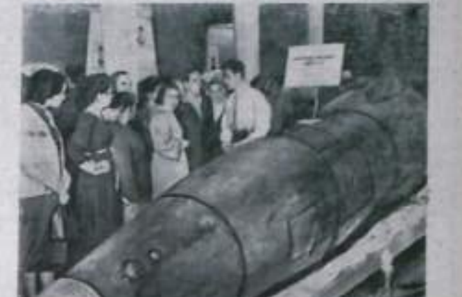
Выставка достижений народного хозяйства СССР. В выставочном зале Академии наук. Посетители осматривают приборный комплекс работы «А-3», работающий на высоте 422 километра.