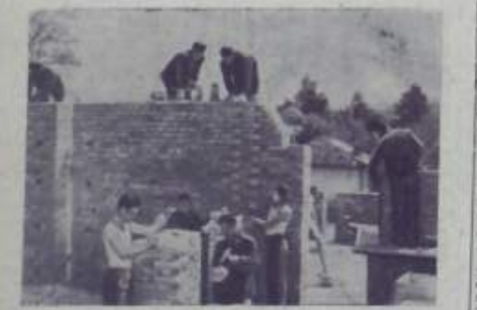
Национальная Республика Венгрия. Студенты строительного техникума имени Е. Демтерова в городе Тирново решают учебные задания по строительству здания.