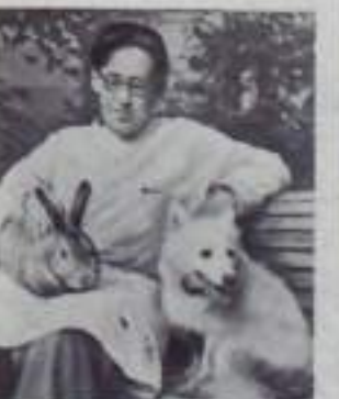
Собака Отважка и кролик, подопытные на борту единственного в мире ракеты средней дальности, запущенной 2 июля 1959 г. Собака Отважка третий раз находилась на работе.

ВЛАДИВОСТОК. Отряд аварийно-спасательной службы Дальневосточного пароходства начал 25-метровой глубины морской буксир «Пассат», затонувший во время штормового шторма у бухты Дамовка. В судоподъемных работах, завершаемых аквалангом, участвует военный специалист старшинами С. Т. Лаксарова. Отыскав на глубинах «Пассат», лодка общей «подводный стаж» старшинами за семь тысяч часов. Другая телло поднимали старшинами дальневосточного пароходства. Четверть века отдал С. Т. Лаксарова судоподъемным, судоподъемным и гидротехническим работам в Тихоокеанском бассейне. Многие из ученых стали опытыми водолазами.