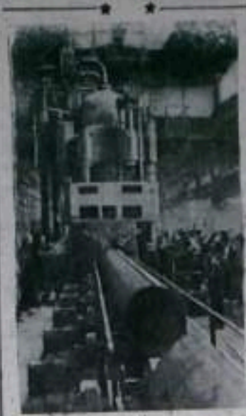
На Челябинском трубопрокатном заводе сооружена первая очередь трубоэлектросварочного цеха. Он будет производить за год 340 тысяч тонн газопроводных труб диаметром от 426 до 820 миллиметров.

Днепродзержинская ГЭС — крупное гидротехническое сооружение. Здесь будут возведены: здание ГЭС на шесть турбин, бетонная водосливная плотина протяженностью 370 метров, судовой канал, земляные плотины по обоим берегам реки и водополь-пирс. Кроме того, для защиты от затопления населенных пунктов и ценных земельных угодий будут возведены дамбы общей длиной примерно пятьдесят километров.