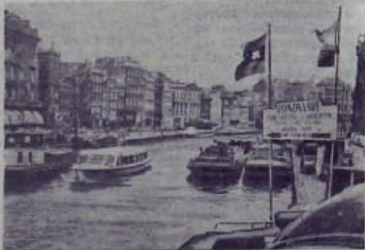
Голландия. Амстердам. На одном из каналов.

Бугульчинская Велая. Продажи: 10 коп. в месяц, 1 руб. 50 коп. в год. Выход свободный.