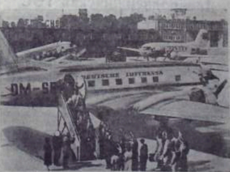
22 июня между Главным управлением Гражданского воздушного флота при Совете Министров СССР «Аэрофлот» и обществом воздушного сообщения «Лифтлан» Германской Демократической Республики подписано соглашение о воздушных перевозках и взаимной обслуживании.

НА СНИМКЕ: самолеты общества «Лифтлан» на берлинском аэродроме Диплинге.